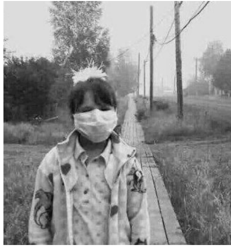
В одном из сёл в районе пожаров люди были вынуждены ходить в респираторах

А тем временем лучи солнца не могли пробиться через плотную пелену дыма, и в результате озёра остывали. Приезжаю-