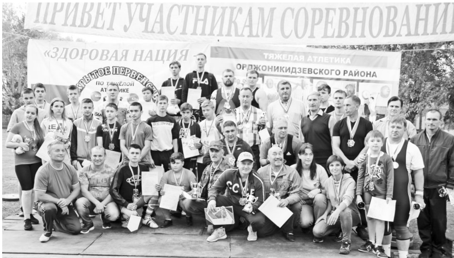
В этот юбилейный день на помосте сражались атлеты всех поколений. А победила любовь к спорту!