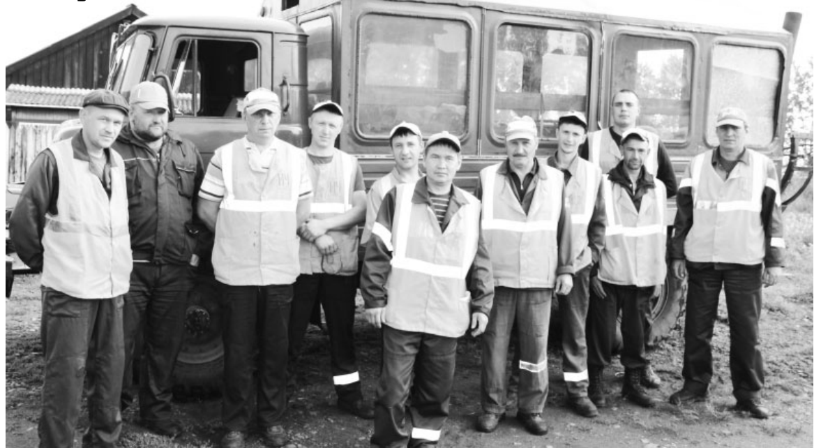
Бригада линейного участка п.Копьево в любую погоду готова выполнять поставленную задачу

- Как обстоят дела с безопасностью на железной дороге?