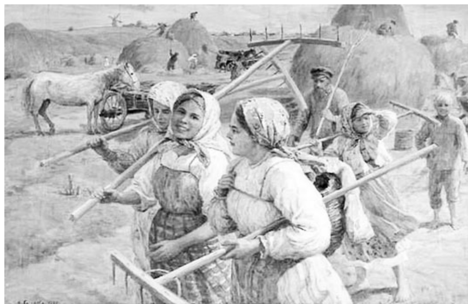
Сычков Федот Васильевич. «На сенокосе», 1950г.

- Ай да жёнушка! Ловко же у тя получается! - улыбаясь, хвалит Егор свою вторую