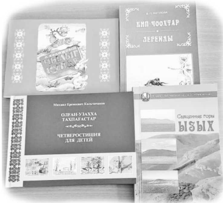
В школе хватает литературы для детей, которые только начинают изучать хакасский язык, и для ребят постарше