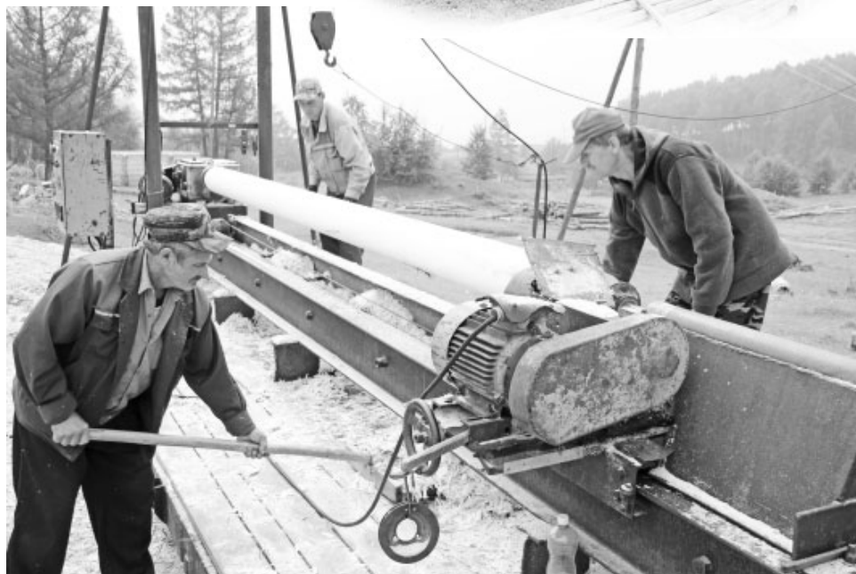
Процесс оцилиндровки бревна

Между тем, жизнь заставляет считать каждую копейку и сокращать расходы, без которых производство может спокойно обойтись. Так, сократили сторожей, а вместо них