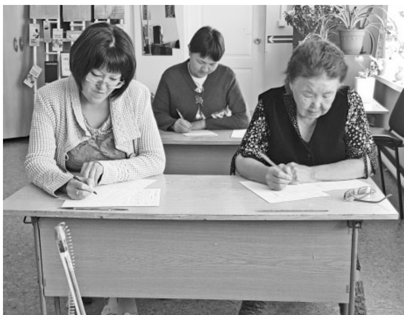
В написании диктанта с удовольствием приняли участие люди старшего поколения

Но всё же нашлись люди, которые пришли проверить свои навыки, в том числе и я. А почему бы и нет? Ведь я живу в Хакасии и просто обязана хоть чуть-чуть участвовать в