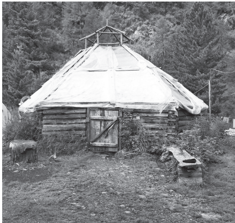
Алтайская изба - аил

После обеда ещё немного лесной грязи, и вот, около четырёх часов дня мы выходим на финишную прямую! Поляна, известная в этих местах под названием «Три Берёзы» – здесь мы будем ждать группу поляков, которые всё ещё где-то в пути. Ну а «шишиги» – аж три штуки, уже стоят, ожидают своих потенциальных пассажиров, желающих доехать до Тюнгюра весело в кузове, а не тащиться в долгий, нудный и бесполезный перевал Кузюк. Сегодня дождя нет, солнце печёт по полной. Занять себя особо нечем – в первую очередь нападаем на заросли лесной малины перед поляной. Малины – море, она хоть и мелкая, но сладкая и вкусная. Едим, покида влезает. Потом располагаемся отдыхать в теньке, неподалёку от стоящих грузовиков, разложив все свои сырые вещи на солнцепёке. Вот и обозначенный час «икс» уже пробил, и вещи все высохли, и солнце за горку пошло. Другие группы с Ак-Кема подходят, «шишиги» заполняют и отъезжают, а наших «боевых товарищей» всё нет и нет. Часам к семи только подошли первые, самые ходкие из них, сообщив нам, что ещё часа два придётся ждать оставшихся двоих, среди которых – участница груп-