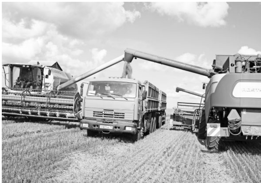
Идёт загрузка зерна нового урожая с дальнейшей транспортировкой на сушильные комплексы

нам, что посевные площади хозяйства составляют порядка 3600 га зерновых, так что вся уборка ещё впереди. На данный момент на обмолоте хлебов заняты 7 комбайнов: 4 Акрона, 1- Туконо Клаас и 2 Енисей. Их обслуживают 3 большегрузных КамАЗа. Поломки техники тоже случаются – а как же без этого! Вот сломался один из трёх КамАЗов, требуемую запчасть доставили оперативно, машина вскоре встанет в строй. Однако в горячую пору очень жалко потерянного в ожидании времени. Ведь пока зерно молотят на ближайших к Монастырёво полях, и двумя большегрузными грузовиками успевают его отвезти от комбайнов на монастырёвский зерноток. Но тут стали направлять зерно также и на когунекскую сушилку, поэтому плечо пробега машины и время её ожидания увеличились в разы. А с тремя-то «пульманами» всё же веселее дело движется.