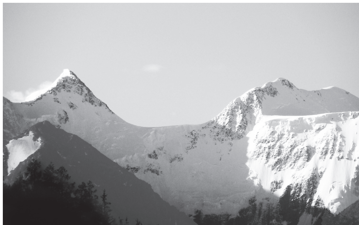
На Алтае есть поверье, что Белуха показывается полностью (обеими вершинами) только тем, у кого чисты дела и помыслы. Остальные её видят в тучах

нах, сплошь покрыты чешуйками какого-то чёрного-пречёрного лишайника (ещё одна алтайская невидаль!) У тебя под ногами чёрные камни, сидишь ты на чёрных камнях и вокруг видишь массивные чёрные осыпи, напоминающие отвалы угольных карьеров. И лишь тропа обычного светло-серого цвета, на ней лишайник давно сбит ботинками туристов и конскими подковами.