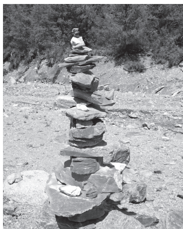
Рукотворные каменные чудеса долины Ярлу

С утра вновь выход по мокрой со вчерашнего дня тропе: снова грязь, камни, корни. На ботинках – по килограмму грязи, очень хочется пройтись по ручью, но, как и вчера – один лишь Ак-Кем где-то далеко внизу шу-