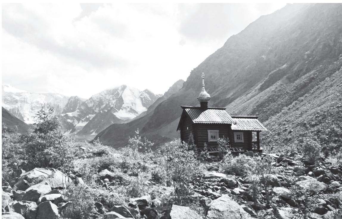
На фоне белизны величественной Ак-Кемской стены – часовенка Михаила Архангела, самая высоко стоящая часовня на территории России, возведена она в этих труднодоступных местах в память о погибших здесь альпинистах и спасателях

Сидя на каменистых склонах и оглядывая ближайше вершины, вдруг ясно и чётко понимаем, почему Кара-Тюрек – «чёрное сердце». По крайней мере, почему именно чёрное. Все камни, крупные и мелкие, образующие россыпи на скло-