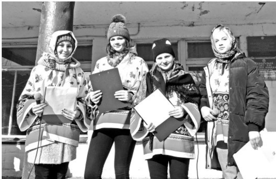
Весёлые скоморохи позабавили всех своими шутками-прибаутками

Масленица – самый радостный праздник в предвкушении наступающей весны. Празднование Масленицы – это не только хороший повод повеселиться, но и возможность вспомнить народную историю.