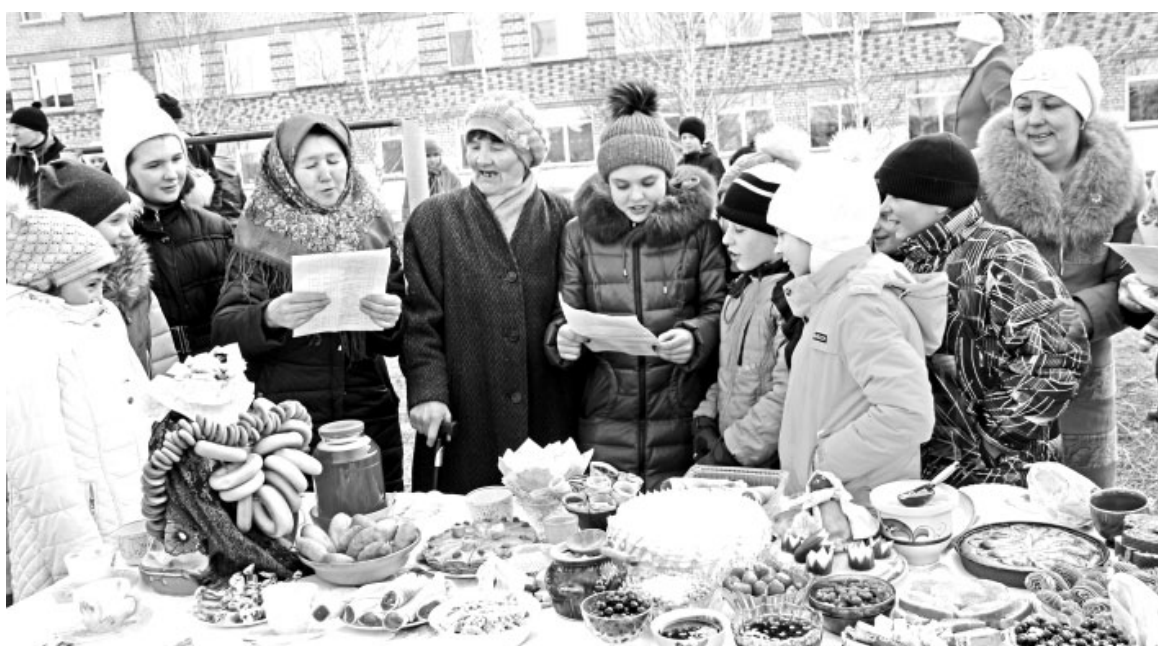
Гостей встречали песнями и масленичными закличками. А от разнообразия угощения глаза разбегаются!

ный масленичный стол» победили 7-8-е классы. «Самый изобильный масленичный стол» – у 10-11-х классов. «Самый традиционный масленичный стол» представил 4-й класс. В номинации «Блины как вид искусства» победу одержал 9-й класс. «Самый щедрый масленичный стол» был у первоклашек. «Самый интернациональный праздничный стол» – у 3-го класса. «Самый яркий масленичный стол» – у 2-го.