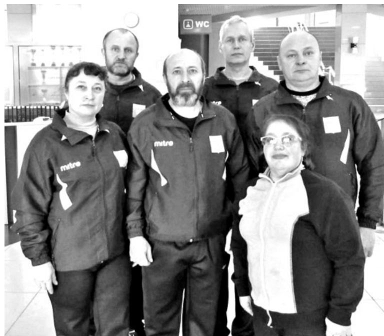
Сборная Орджоникидзевского района

2 марта в Абакане на базе спорткомплекса «Абакан» состоялся республиканский зимний фестиваль Всероссийского физкультурно-спортивного комплекса «Готов к труду и обороне» (ГТО).