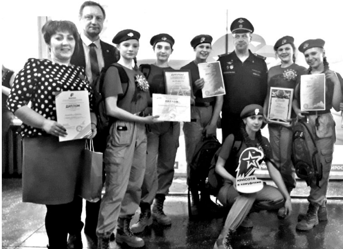
Команда «Патриот» Копьёвской СОШ