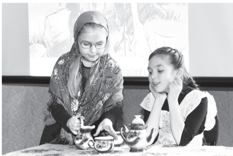
«Бабушка» за кружечкой чая рассказывает «внучке» свою любимую басню «Квартет», за которую когда-то получила пятёрку