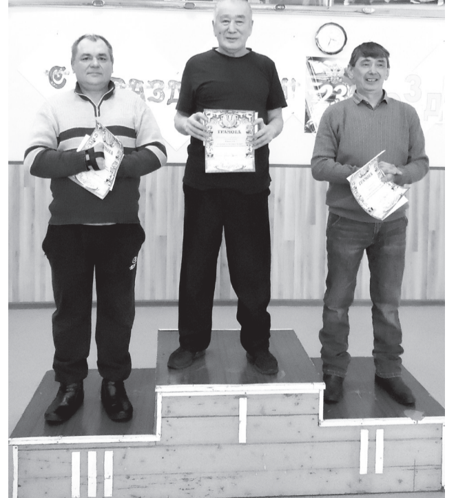
Все призовые места по бильярду забрала команда д.Конгарово