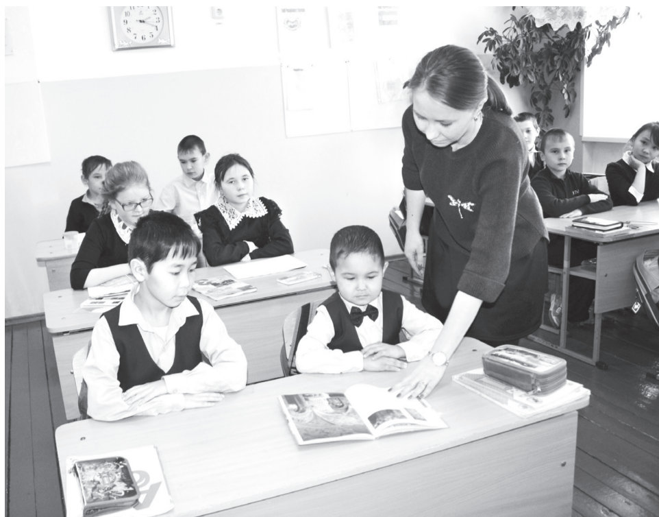
В Подкаменской начальной школе с давних времён учительствуют именно уроженцы данной деревни

– Когда и медпункт есть, и медик в нём работает, то на месте и назначенные врачом уколы поставишь, и капельницы. Вот мне необходимо проставить курс капельниц – еду на центральную усадьбу. И хорошо, что муж имеет такую возможность – свозит меня без проблем, хотя и бензин нынче дорог, но здоровье дороже – ездим. Однако не каждый так может, а жизненные ситуации у людей возникают самые разные, поэтому медработник нам