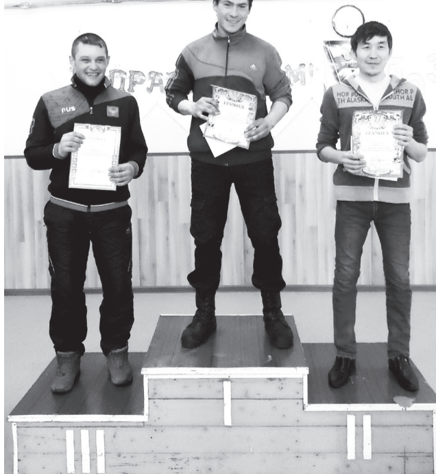
Молодёжь д.Монастырёво заняла весь пьедестал в соревнованиях по теннису