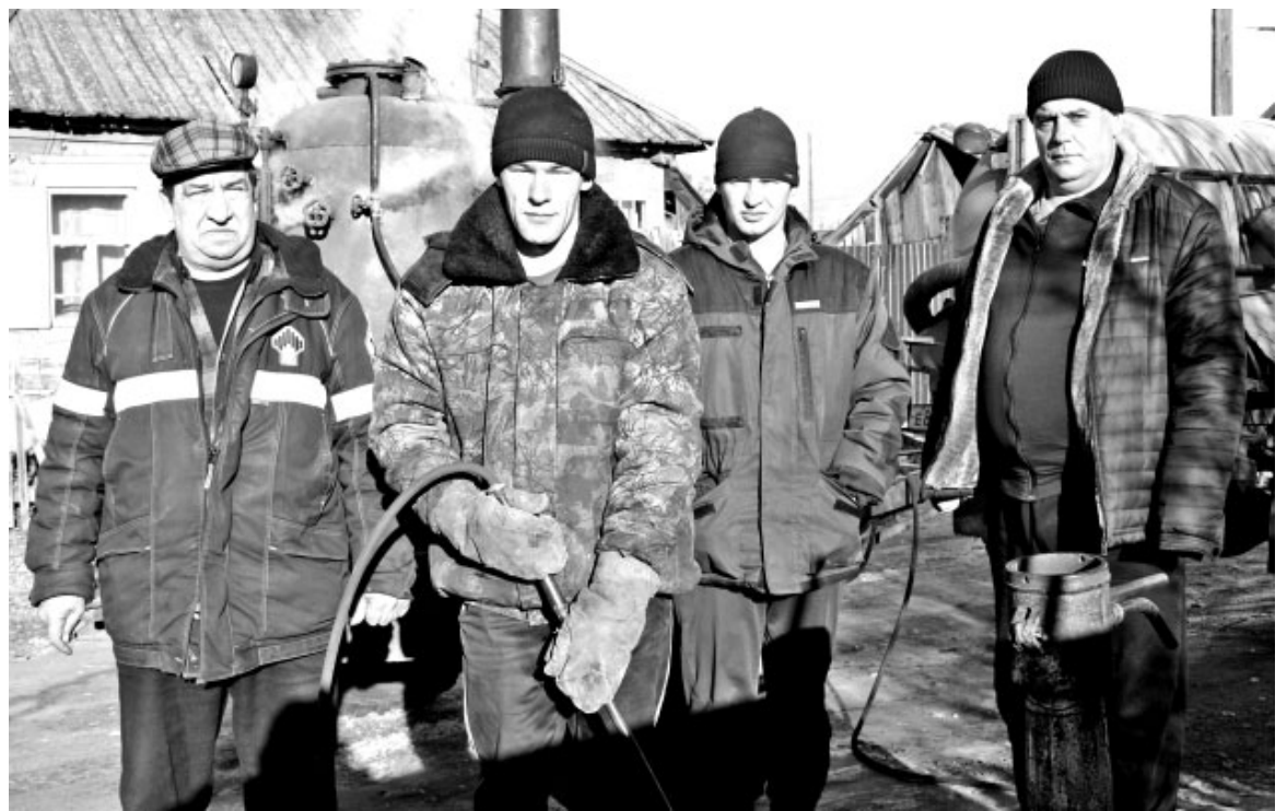
Труженики участка водопроводного хозяйства - сродни реаниматорам: то там, то тут оживляют изношенные водные артерии посёлка

Имея заблокированные счета и арестованную кассу и, наоборот, не имея средств к существованию, а также экскаватора, как