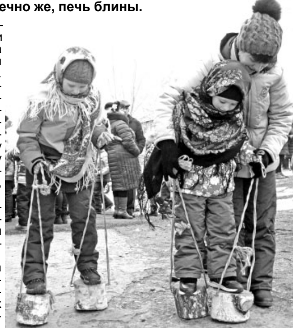
В традиционных русских состязаниях с удовольствием участвовали не только малыши, но и ребята постарше