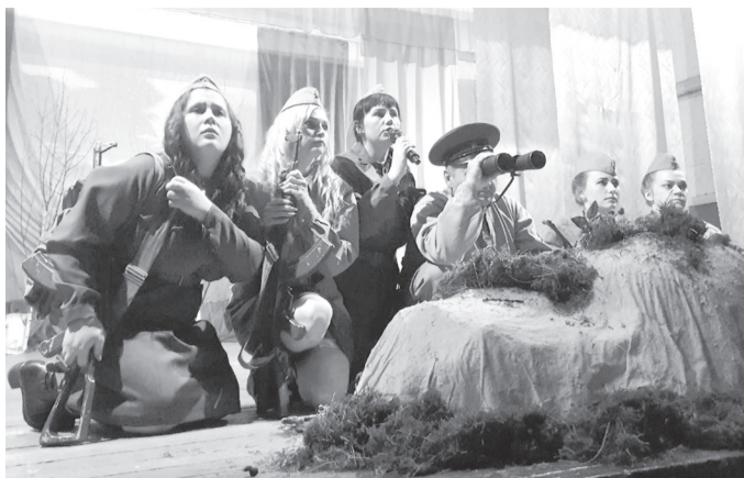
Спектакль «А зори здесь тихие...» с аншлагом прошёл в Июсском СДК. Зал был полон, зрители аплодировали стоя

После полевой кухни жителей и гостей села ждал грандиозный праздничный концерт «А песни как годы летят», где наши зрители увидели новых солистов, новые номера художественной самодеятельности, погружающие всех в атмосферу событий, которые коснулись миллионов солдатских сердец, их родных и близких – наших родных и близких, на-