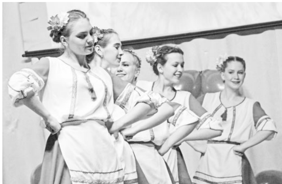
«Смуглянка» от образцового коллектива «Вдохновение» – эталон хореографического мастерства

это только малая часть наград наших танцоров!