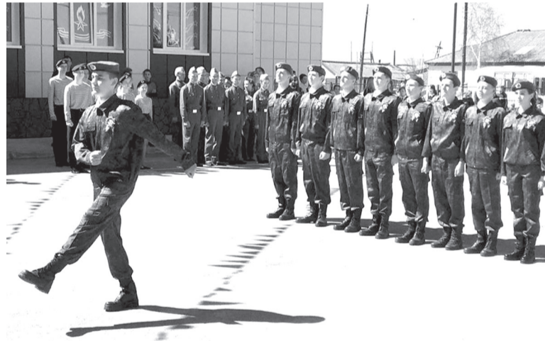
Строевая подготовка - самый зрелищный этап конкурса

Конкурсная программа началась с самого зрелищного этапа – строевой подготовки. Погода в этот день благоволила участникам. Яркое солнце и отсутствие ветра позволили провести строевую подготовку на настоящем плацу. Ребята показали всю свою выучку и мастерство, как командиры подразделений, так и непосредственные исполнители, а ведь среди них в строю стояли и девушки, которые ни в чём не отставали от юношей, а порой и превосходили их в чёткости строевого шага. Зрители были в восторге, шептались: «Хоть сейчас на Красную площадь, на Па-