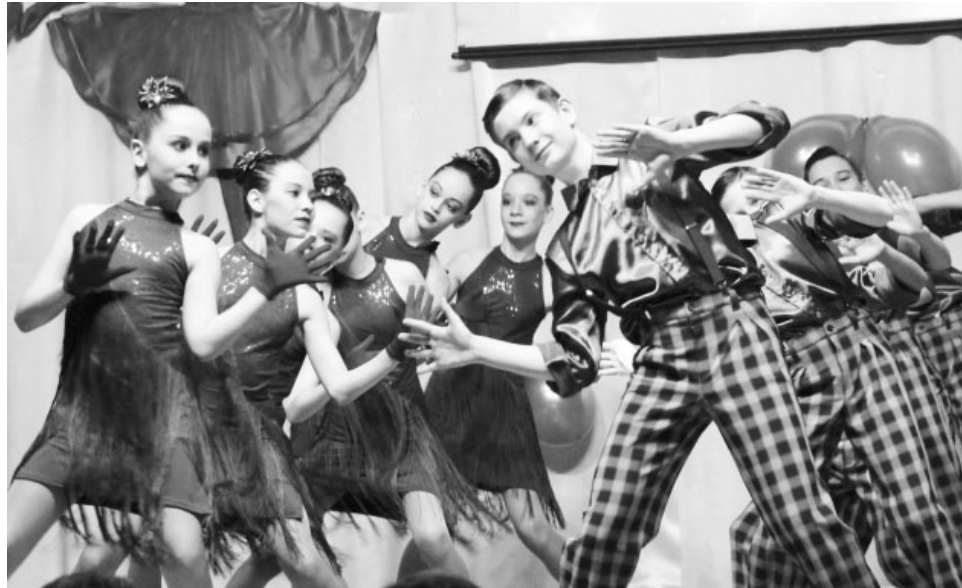
Яркий, зажигательный джайв исполнила студия бального танца «Шарм»