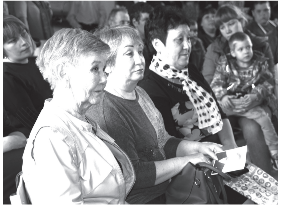
Среди гостей презентации альбома - воспитанники Саралинского детдома и их родственники

1 августа 1955 года исполком облсовета принял решение о расформировании детского дома. Свою послевоенную функцию он выполнил: все воспитанники были выпущены и трудоустроены. А в опустевшие здания переселили детей Ширинского пансионата, и детдом переименовали в интернат-пансион.