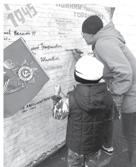
Около клуба установили стенд, на котором жители писали фамилии своих родственников и указывали временной период, когда они воевали на фронтах Великой Отечественной. К концу дня стенд был полностью заполнен.

Администрация Копьёвского сельского Дома культуры выражает огромную благодарность за помощь и совместное проведение праздника администрациям Копьёвского сельсо-