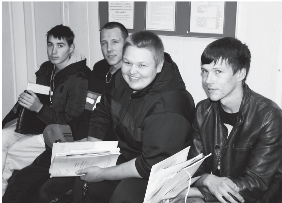
В очереди у кабинета призывной комиссии призывники с энтузиазмом обсуждали будущую службу

- В назначенный день отбытия парни сначала самостоятельно добираются до села Шири. Там на сборном пункте их комплектуют. Далее уже за счёт государства они едут в Абакан, где их передевают в форму по сезону и в соответствии с видами и родами войск. Бывают случаи, когда призывник вдруг возвращается отсюда домой. Такая ситуация редка, и возникает тогда, когда по каким-то причинам