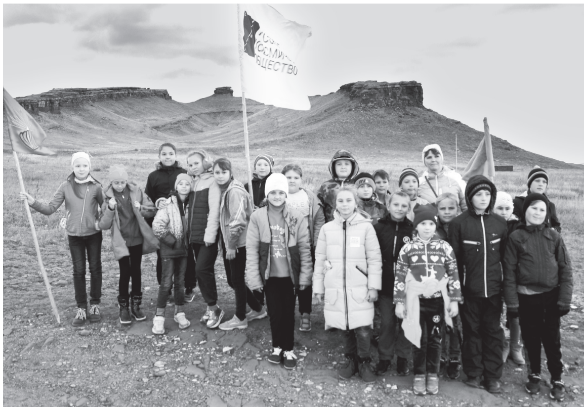
Поездка на «Сундуки» подарила много новых ярких впечатлений

- Мне очень понравилась поездка на «Сундуки». Потому что мы узнали о древних шаманах. На одном холме под сосной похоронен древний воин, ино-