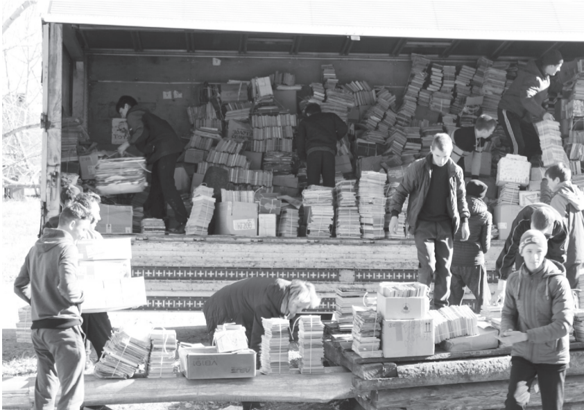
Общими усилиями июсцы собрали почти 6 тонн макулатуры!

Самыми активными участниками эко-марафона стали: 3-й класс – 965 кг макулатуры, 9-й класс – 928 кг, 5-й