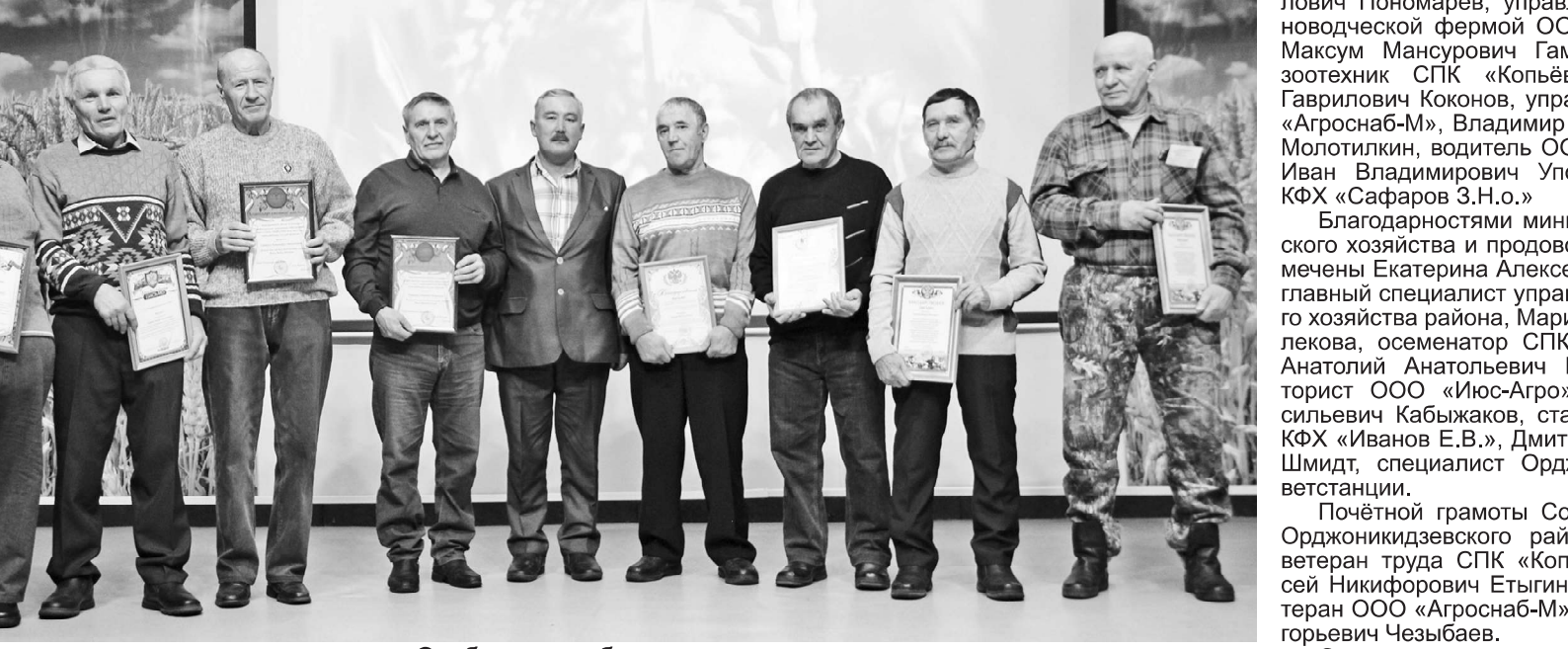
Особые слова благодарности - в адрес тружеников, всю свою жизнь посвятивших развитию сельского хозяйства района

ьского хозяйства нашего более двух тысяч чело- механизаторы, животно-