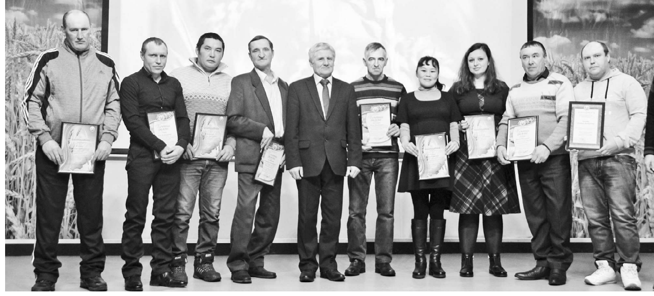
Среди награждённых от Минсельхоза - руководители по... специалисты и рядов...