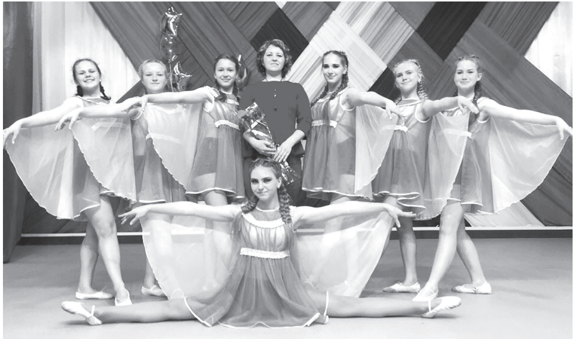
Семь талантливых девчат - гордость руководителя

«Во время выступления я стараюсь не думать ни о чём лишнем – просто смотрю на зрителя, ловлю их эмоции. Танцем