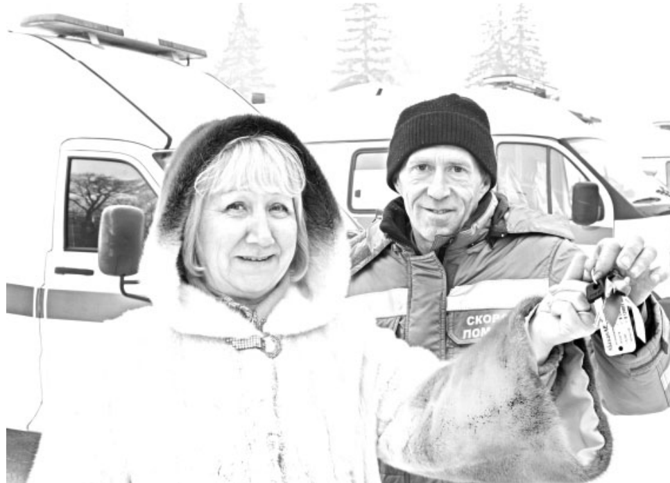
«Скорые» быстро вырабатывают ресурс, поэтому новый спецтранспорт весьма кстати

- По нацпроекту «Здоровье» с 2006 года наша больница уже получала спецавтомобили, но за это время они выработали свой ресурс, особенно с учётом частых поездок в г.Абакан – доставляя тяжёлых больных. И вновь потребовалось обновление автопарка. С 2017 года мы опять стали получать «скорые». Очень ценно, когда спецтранспорт поступает по федеральной программе, а не приобретается на средства республиканского или местного бюджетов: тогда автомобили ещё и полностью укомплектованы необходимым медоборудованием. Вот и у полученной «скорой» есть всё для оказания экстренной медицинской помощи и проведения неотложных реанимационных действий. По сути, это тот же реанимобиль. При его стоимости в 2,3 млн рублей медоборудование «тянет» на миллион с «гаком». Вот и представьте, какой это по-настоящему ценный