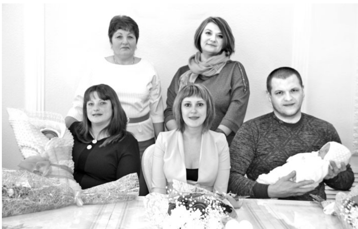
Сразу двое малышей появились на свет в нашем районе 2 января