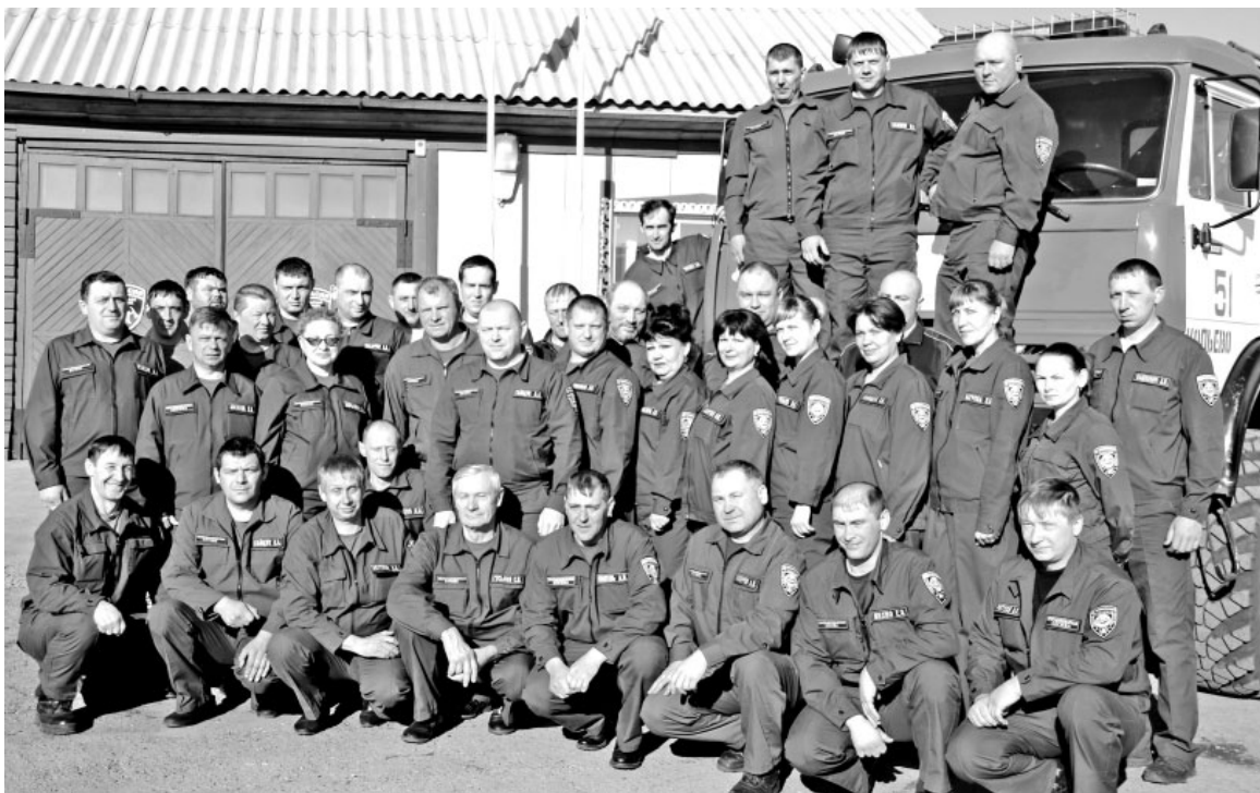
Коллектив ПЧ-51 сегодня

О дне сегодняшнем ОПС РХ №5, о делах и успехах, о проблемах и заботах, волнующих про-