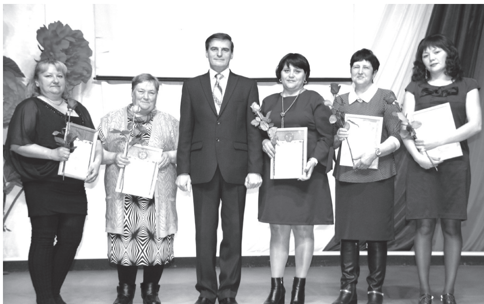
Почётной грамотой Администрации Орджоникидзевского района награждены ветераны и специалисты сельсоветов

ную работу, деятельное участие в мероприятиях, проводимых органами местного самоуправления района, Почётные грамоты и Благодарственные письма Совета депутатов Орджоникидзевского района вручены депутатам по округам.