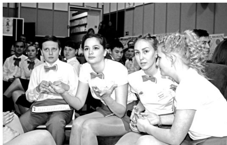
Команда Устино-Копьёвской школы отвечает на вопросы конкурса «Избирательный дозор»