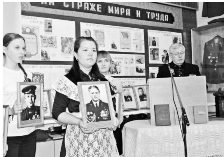
Уже несколько лет «Георгиевские чтения» остаются одной из крупнейших научных конференций учащихся республики. Муниципальный этап в Орджоникидзевском районе прошёл во второй раз, и вновь – в музее с.Копьёво.