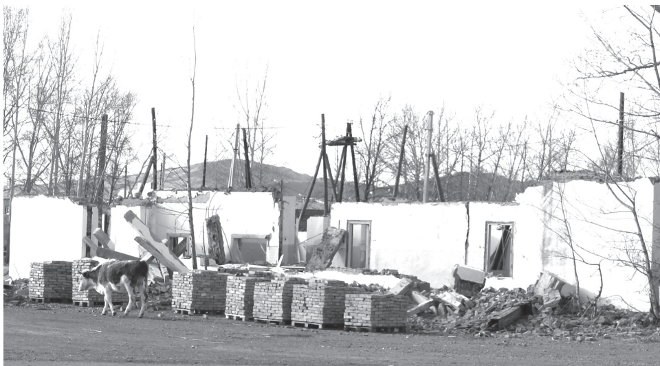
Возмущались июсцы и по поводу разобранного «по кирпичику» здания бывшей совхозной столовой, находящейся в самом центре села

- Дальше так продолжаться не может! Мы вынуждены пойти на жёсткие меры: молоко у недобросовестных сдатчиков принимать больше не будет. И не стандарт возвращать назад тоже не будем, выльем тут же в канализацию. Про-