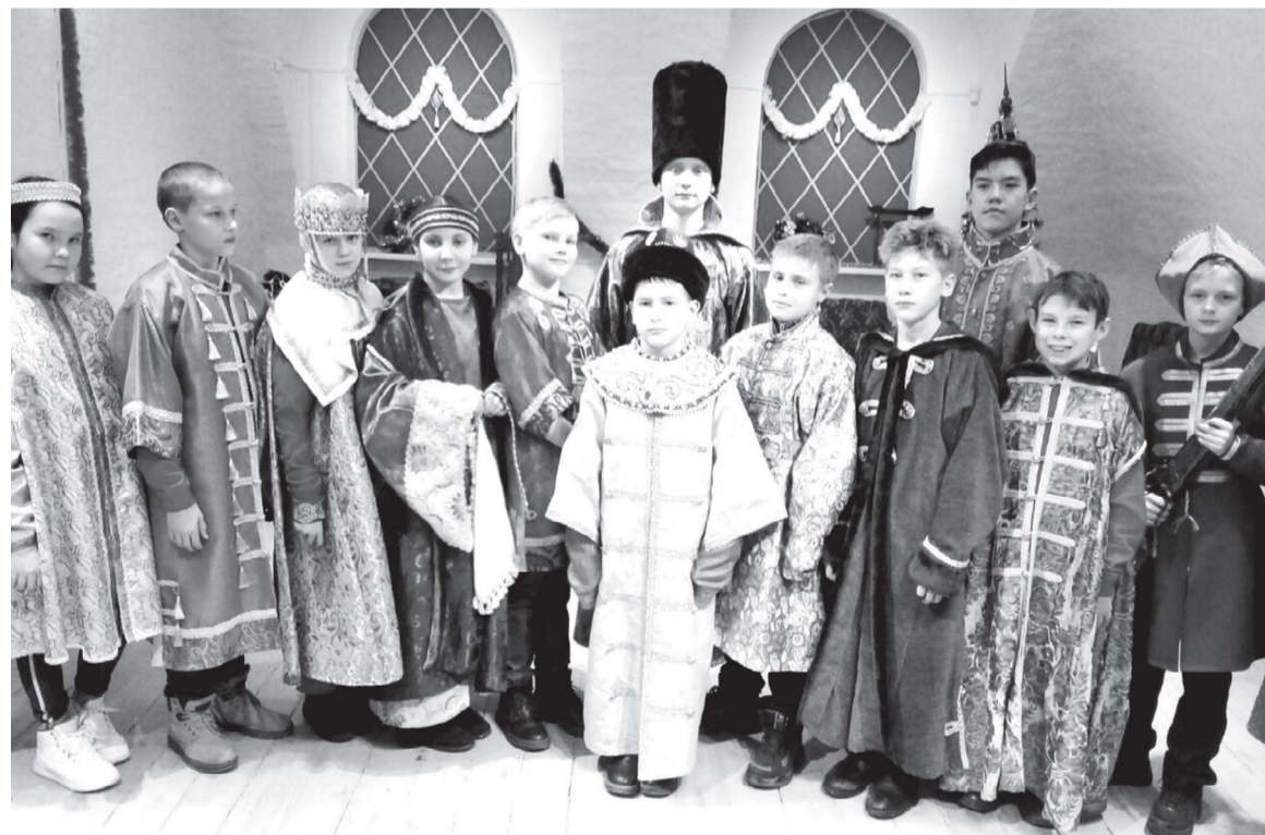
На следующий после представления день ребята посетили Измайловский Кремль, где познакомились с бытом русских царей и примерили царские одежды