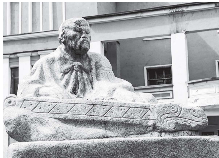
В столице Хакасии установлен памятник – «Хакас, играющий на чатхане»

Народные исполнители, как правило, не знакомы с нотной грамотой и настраивают мелодические струны по известной им мелодии. Игру на чатхане