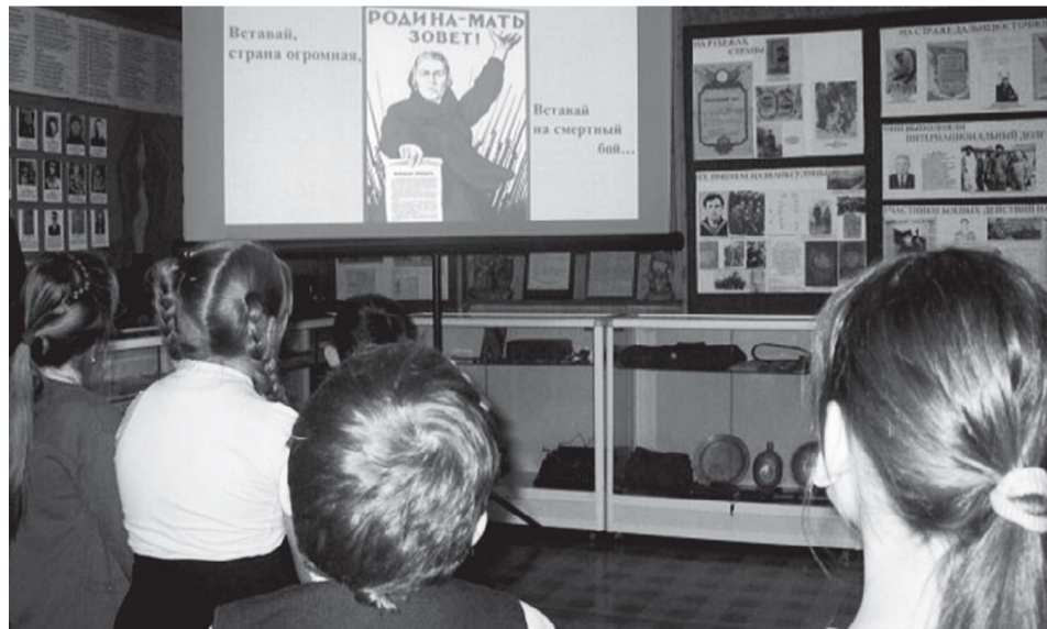
Кадры военного времени не оставили детей безучастными

Год памяти и славы в честь 75-летия Победы в Великой Отечественной войне (Указ Президента России В.В. Путина от 08.07.2019 № 327) музей района открыл двумя мероприятиями: «Блокадный хлеб. 900 дней мужества» и «Сталинградская битва. 200 дней и ночей мужества и героизма».