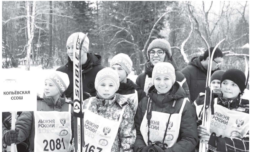
- В команде школы нас было шестеро: три педагога, три ученика. И ехали мы не столько на соревнования, сколько за настроением

Единственное, что оставило неприятные воспоминания - томительное ожидание старта... Хотелось уже пробежать (или пройтись) скорее по трассе и не обременять себя грузом волнения за предстоящую гонку.