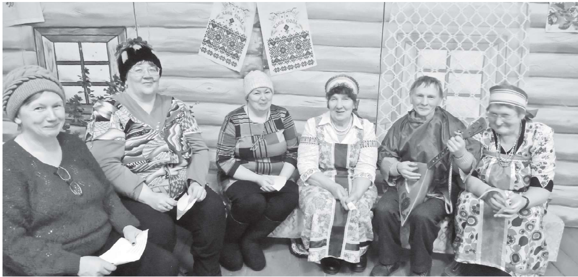
Деревенские частушки под балалайку всем пришлось по душе

В программу посиделок были включены традиционные зимние обряды, начиная с Покрова. До принятия Христианства год на Руси делился на два крупных сезона – зиму и лето. Оттуда и поверье в народе: сколько лет, столько зим. Поэтому и праздники в те далёкие времена делились на зимние и летние. Зимними считались те, которые отмечались с Покрова до Масленицы. А 14 февраля, на Сретенье, зима и лето встречались.