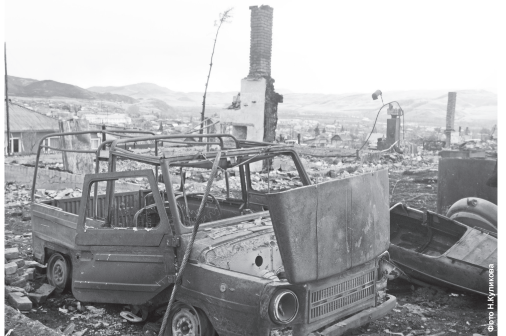
2015 год, п.Копьево, улица Южная