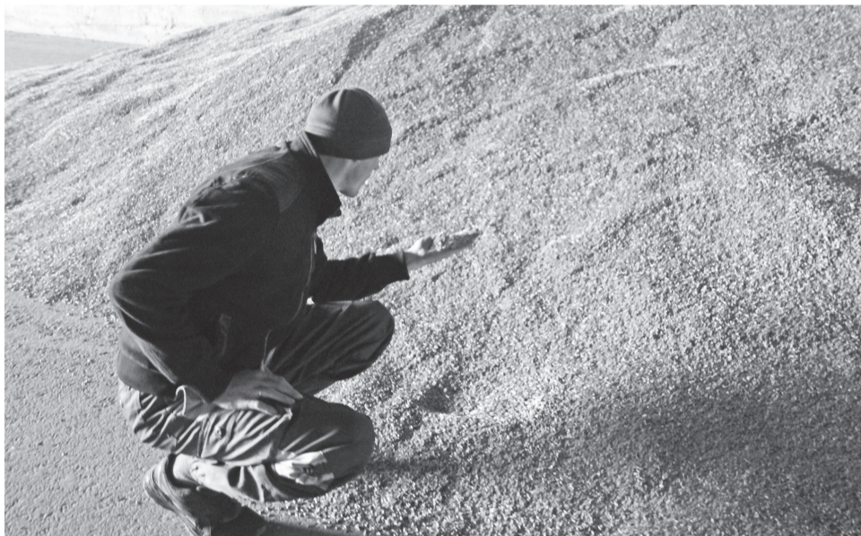
Как говорят аграрии, помешать севу может только погода

меры по снятию запрета на деятельность сельхозпредприятий, в том числе на организованное проведение весенне-полевых работ.