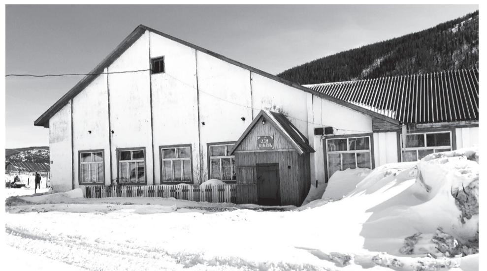
Сельский Дом культуры давно в аварийном состоянии

Сейчас тоже проводятся молодёжные дискотеки, но народа мало, это и понятно: те, кто постарше, учатся в городах, а школьники не все посещают танцы. Бывает, конечно, что собирается много народа, но как-то всё не так и не то. Сидят по углам, уткнувшись в телефоны, так и хочется