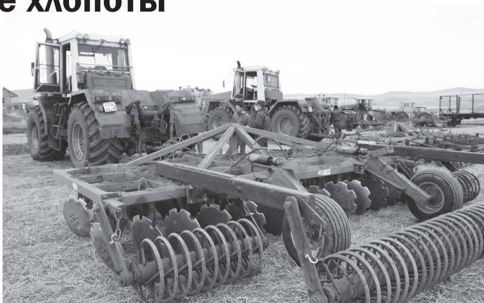
В "Июс-Агро" прошёл смотр техники, задействованной на весенних полевых работах

Как говорят аграрии, помешать севу может только погода, поэтому Минсельхозпрод Хакасии, выполняя Указ Президента «О мерах по обеспечению санитарно-эпидемиологического благополучия населения на территории РФ в связи с распространением новой коронавирусной инфекции», уже предпринял