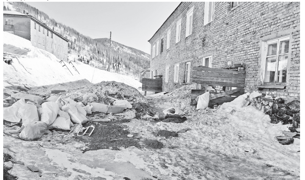
Двор, милый двор...

PS: Пока верстался номер, мусор со двора дома по улице Центральная, 2, вывозили дважды. Выполнило эту работу местное ЖКХ. Но мусора ещё достаточно, особенно с учётом того, что часть его находится под снегом и постепенно оттаивает.