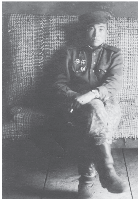
Отец почти не рассказывал нам о войне. Но мы видели шрамы на его теле