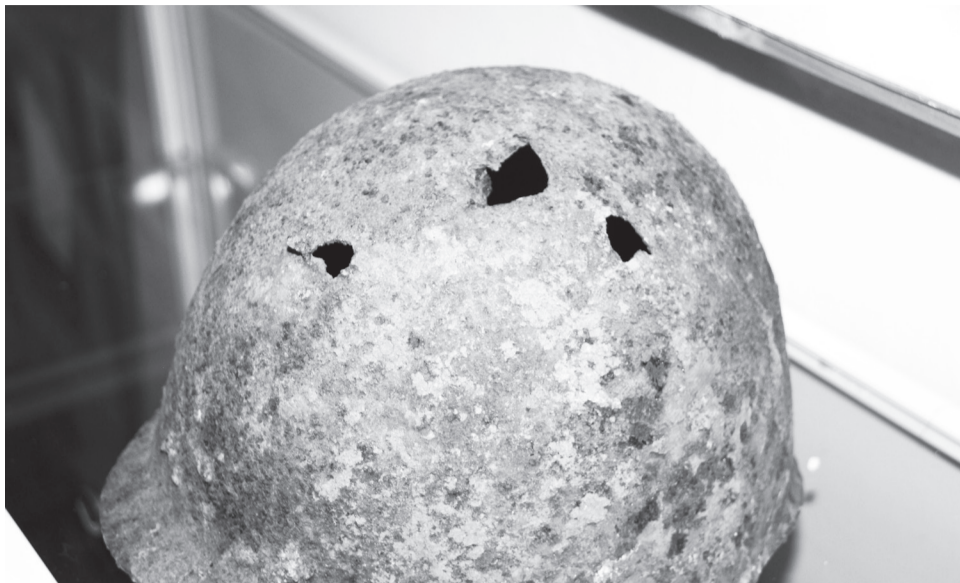
Пожелтевшая каска советского солдата. Экспонат времён Великой Отечественной войны, найденный участниками поискового отряда г.Красноярск