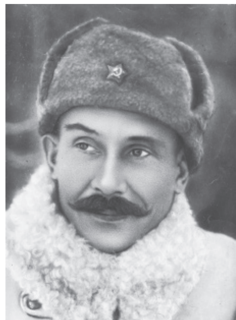
Ноябрь 1944 г. На обороне советского Заполярья