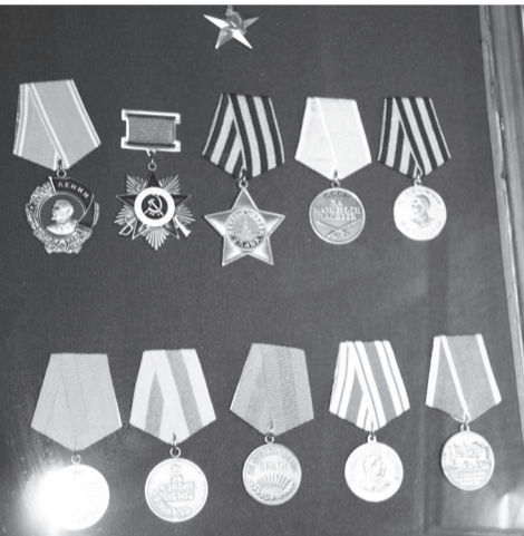
Дубликаты наград С.Я.Котюшева, подаренные музеем сыном героя

ского Союза и фото героя уже в мирное время.