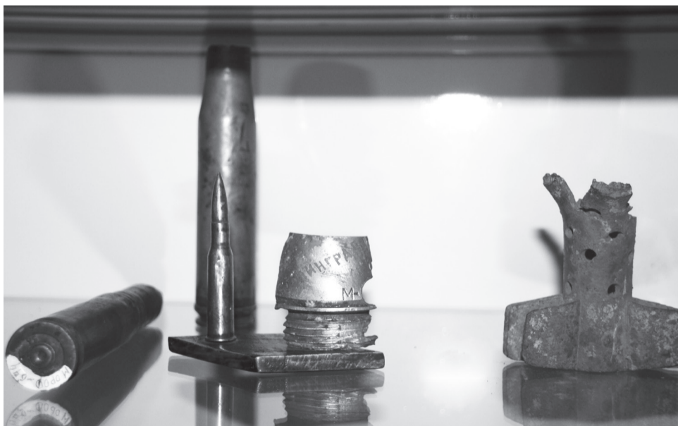
Пули, осколки снаряда и фугаса - страшное напоминание о Великой Отечественной войне