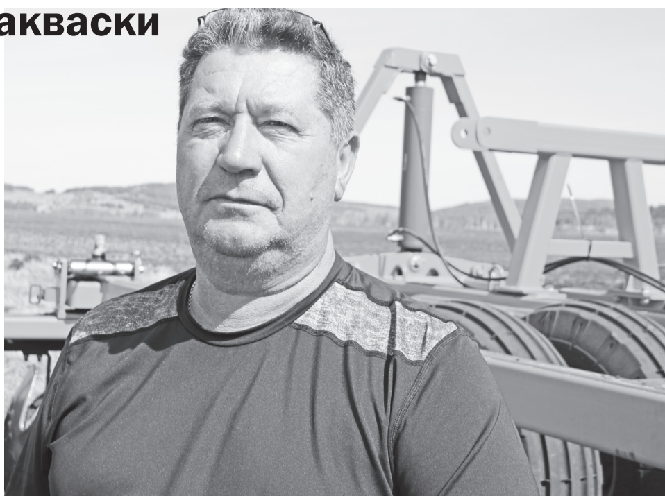
Из года в год у Погребного стабильно самая высокая урожайность зерновых среди местных растениеводческих хозяйств

Годы идут, стараниями неутомимого труженика хозяйство прирастает новыми землями. Но наряду с этим растут