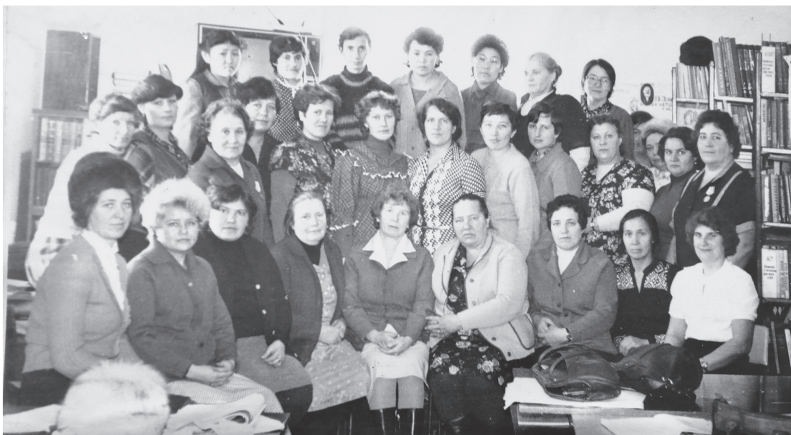
Таким большим стал коллектив Орджоникидзевской ЦБС в начале 80-х годов

Ежегодно Министерство культуры Республики Хакасия проводит конкурсный отбор на предоставление субсидии из республиканского бюджета Республики Хакасия бюджетам муниципальных образований Республики Хакасия на государственную поддержку лучших работников сельских учреждений культуры,