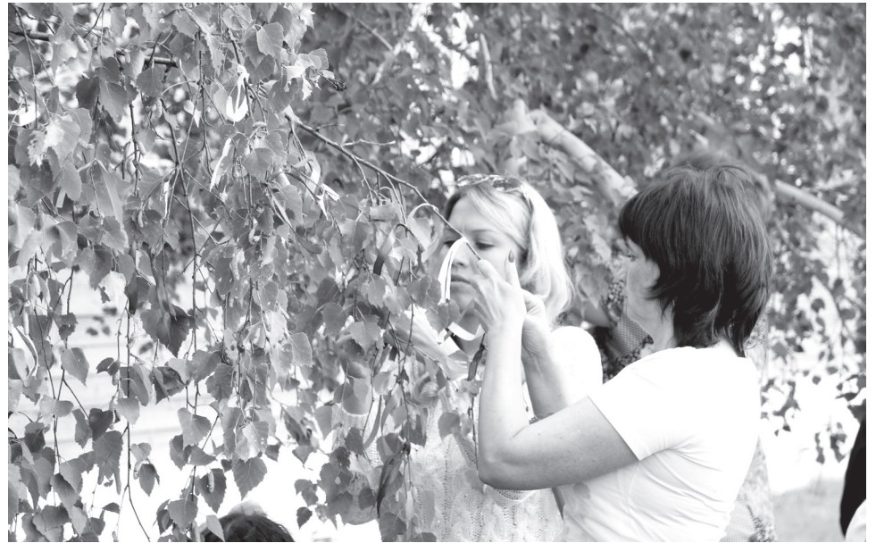
В Хакасии издревле относились к берёзе с особым почтением

Чага - это гриб в виде нароста, снаружи он чёрный, как бы обугленный, внутри - тёмно-коричневый. Поверхность - бугристая, с неглубокими трещинами. Собирают гриб можно только на живых дере-