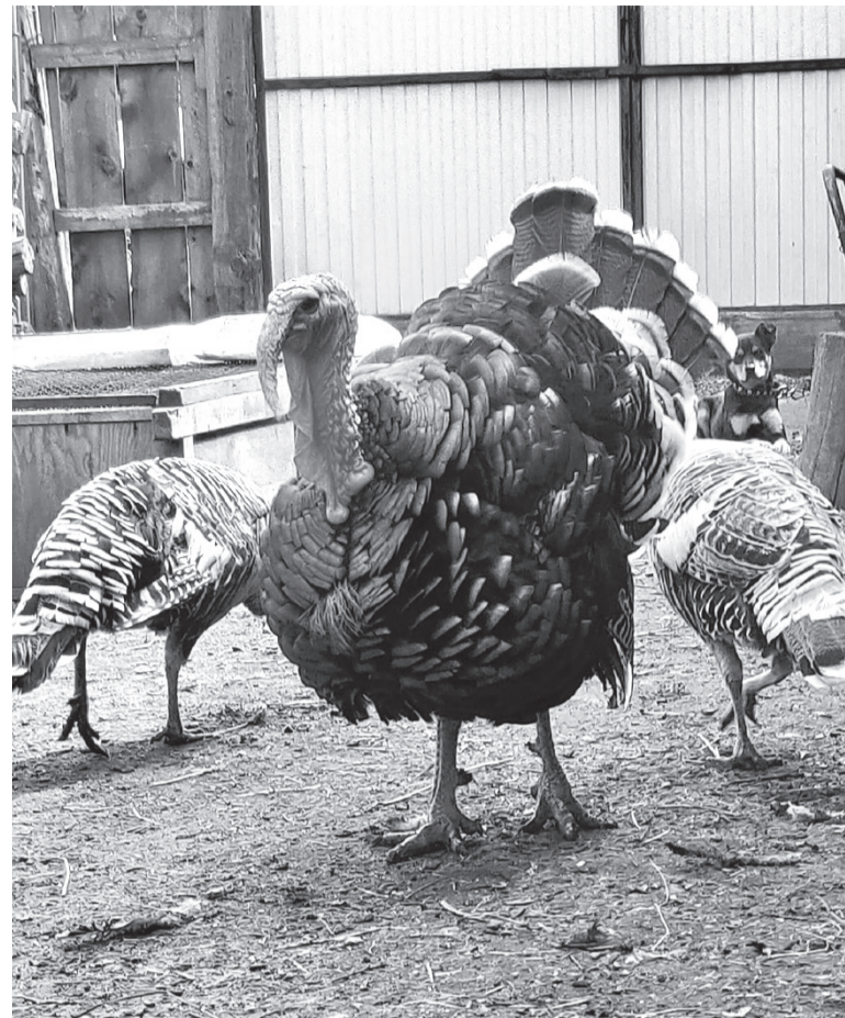
Индюк во дворе - как султан во дворце. Делает, что хочет, и на женщин (пардон, индюшек) не смотрит

А что касается вывода потомства, то лучшей наседки не найти: индюшка – самая усидчивая и терпеливая птица. Главное – определить для высидывания яиц такое место, где бы никто и ничто не могло потревожить наседку. Хозяйка давно заметила, что самочка сама может днями не вставать с гнезда, поэтому, чтобы птица не ослабла, она аккуратно поднимает её, беря осторожно за крылья, чтобы та не только поела зерна и попила воды, но и размяла свои крылышки и лапки. И вот через положенное количество дней, зайдя в очередной раз проверить и накормить всю птицу, хозяйка слышит слабый, но постоянно повторяющийся писк. Это сигнал! Значит, в хозяйстве прибыло: начали проклёвываться из яиц птенцы.