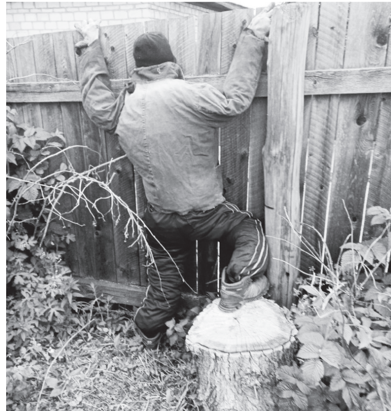
Вот такое самодельное чучело на диво прохожим поставил в палисаднике наш коллега. А как Вы украсите свои ограды и полисадники?