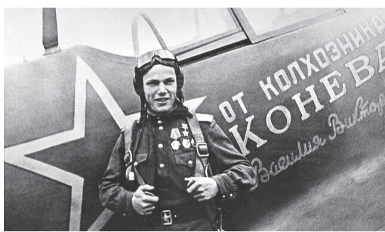
Иван Никитович у именного самолёта

В его биографии была ещё одна война - в Северной Корее, где он командовал эскадрильей и воевал уже против наших бывших союзников - американцев. Но лётные вылеты он не делал, ему запретили летать на боевые задания, берегли Героя. 25.06.1950 г. - дата начала войны в Северной Корее. Прошло ровно 70 лет. С декабря 1950 года командир 324-й истребительной авиационной дивизии (64-й истребительный авиационный корпус) уже полковник Кожедуб находился во главе дивизии в правительственной командировке в Северном Китае (псевдоним - «Крылов»). С апреля по декабрь 1951 года под его командованием дивизия приняла участие в Корейской войне