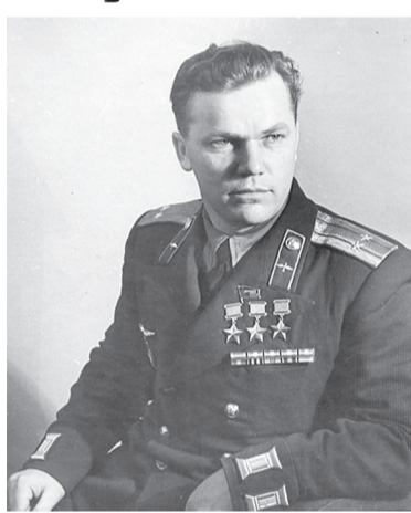
Трижды Герой Советского Союза И.Н.Кожедуб

Затем - 3-й Прибалтийский фронт, Висло-Одерская, Берлинская операции. 19 февраля 1945 г. Кожедуб сбивает реактивный Me-262. Также «под задачу» попали два американских «мустанга»: они по ошибке атаковали Ла-7 Кожедуба и были сбиты. Даже на земле один из сбитых лётчиков был уверен, что