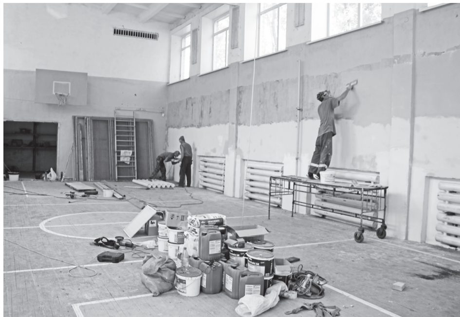
В спортивном зале Устино-Копьёвской школы идёт капитальный ремонт

Перемены радуют. И всё-таки основной вопрос: когда же в Устино-Копьёв-