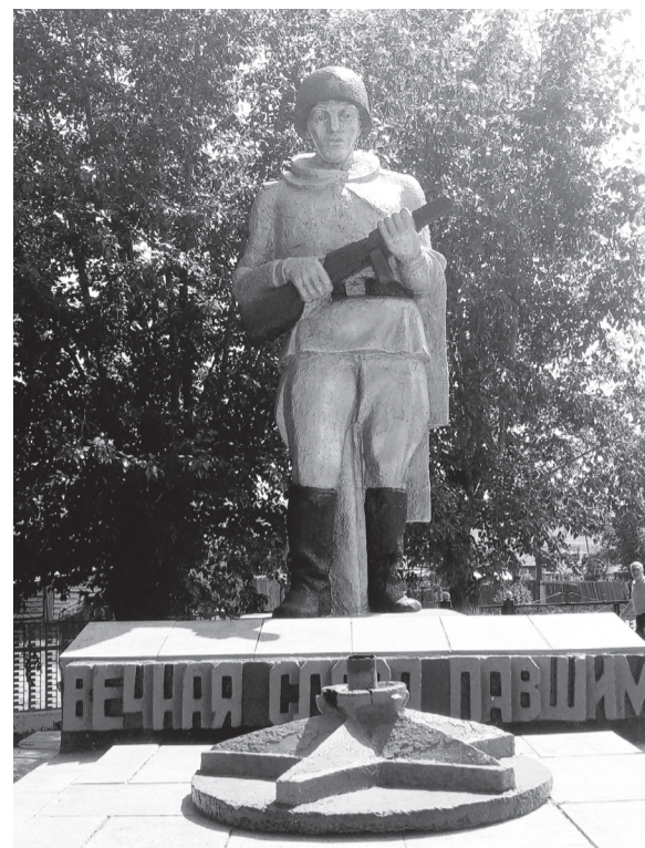
Памятник воинам, павшим за Родину в годы Великой Отечественной войны, с.Копьёво. Установлен в 1981 году. Автор неизвестен

Памятники жертвам войны и героям Победы... Их много у нас в стране, в разных концах мира. Иногда, кажется, слышно, как в тишине ночей каменными и бронзовыми голосами они ведут между собой строгую и торжественную беседу, переключку славы, скорби и горести. Сквозь шум и биение торжествующей жизни до чуткого уха доходит хор их голосов, напоминающий о прошлом.