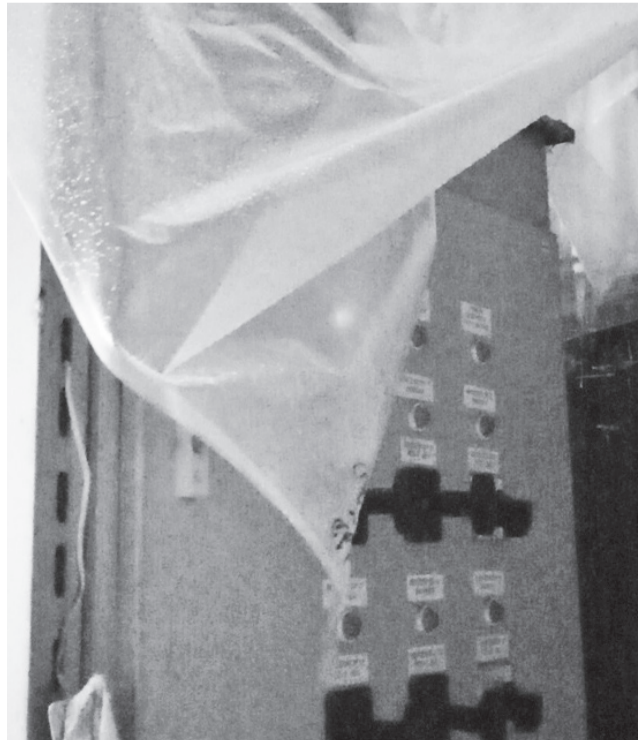
На здании копьёвской насосной станции протекла крыша. Приборы пришлось укрывать полиэтиленом