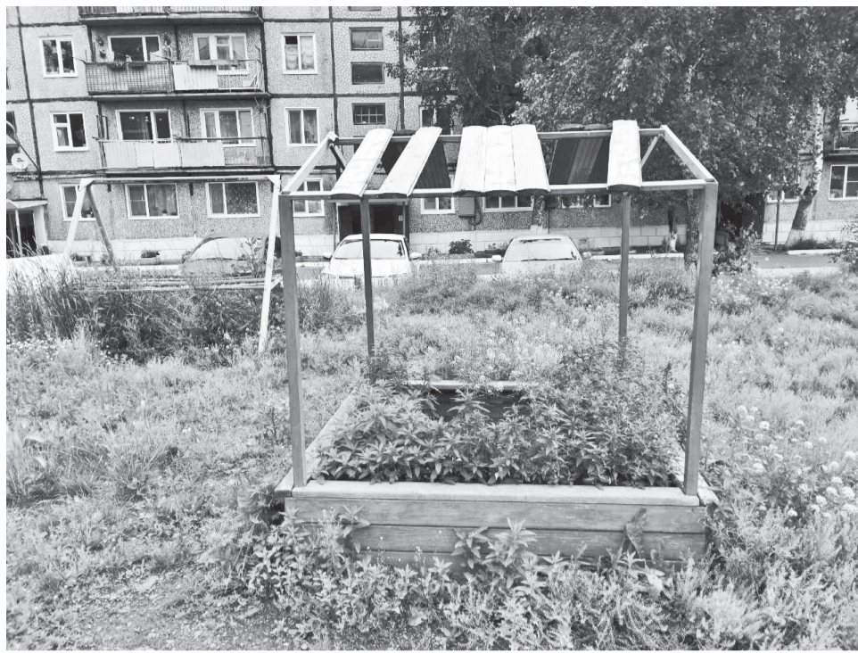
Так выглядит детская песочница 21 века

Есть и предложение: вот если бы активисты заранее определяли дату и время субботника и оповещали об этом остальных,