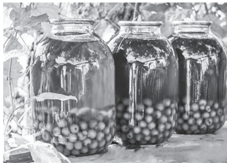
Домашние заготовки – самые вкусные и ароматные

Итак, моем плоды, готовим баночки. На 1 кг. абрикосов без косточек (варим половинками) берём 800 гр. сахара. Подготовленные фрукты засыпать сахаром, хорошо встряхнуть и дать постоять ночь в холодильнике. На следующий день ставим варить в кастрюле с толстым дном из материала, который не окисляется. Варим на среднем огне. Доводим до кипения и с момента закипания кипятим пять минут. Выключим, остудим и вновь на