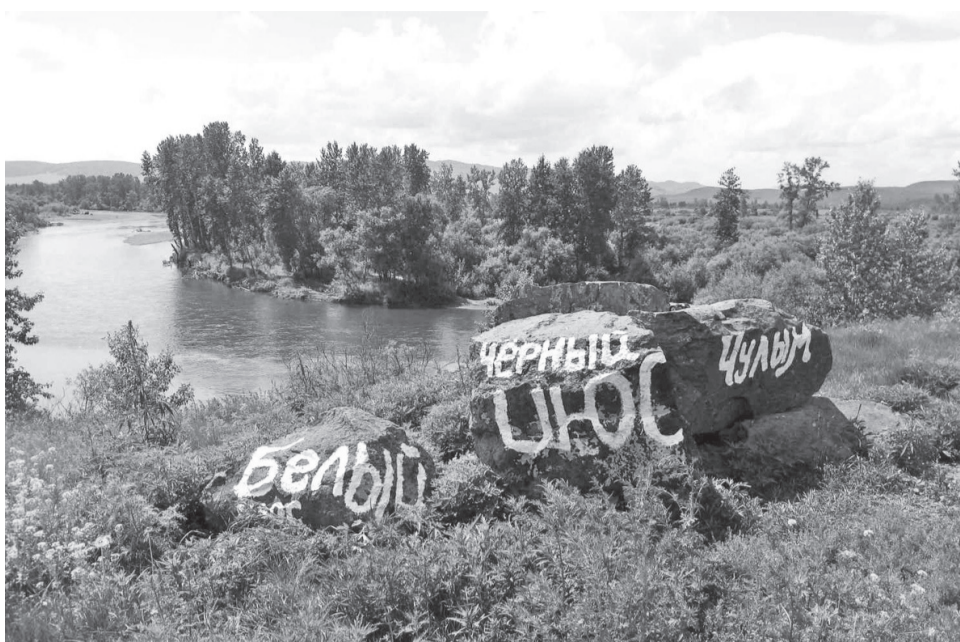
У всех народов особо почитаемым, священным местом считаются истоки рек. А исток Чулыма получил силу сразу двух начал

Ежегодно они справляли праздник Новруз. Новруз с персидского означает «новый день». Праздник Новруз связан с