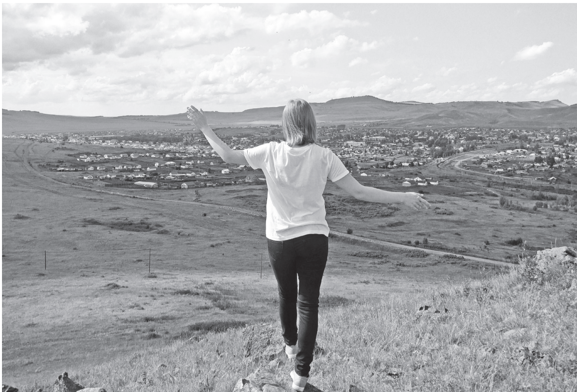
Я всегда люблю ставшим для меня родным посёлком, и на то время, что я живу здесь, он однозначно становится для меня домом

Ни одно лето не обходится без походов на речку или поездок на озёра, чтобы погрузиться в чистую водную гладь в жаркое