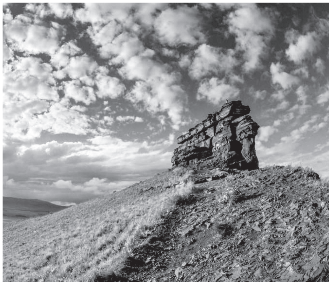
Музей-заповедник Сундуки, с.Июс