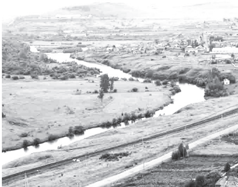
Река Чулым, п.Копьёво