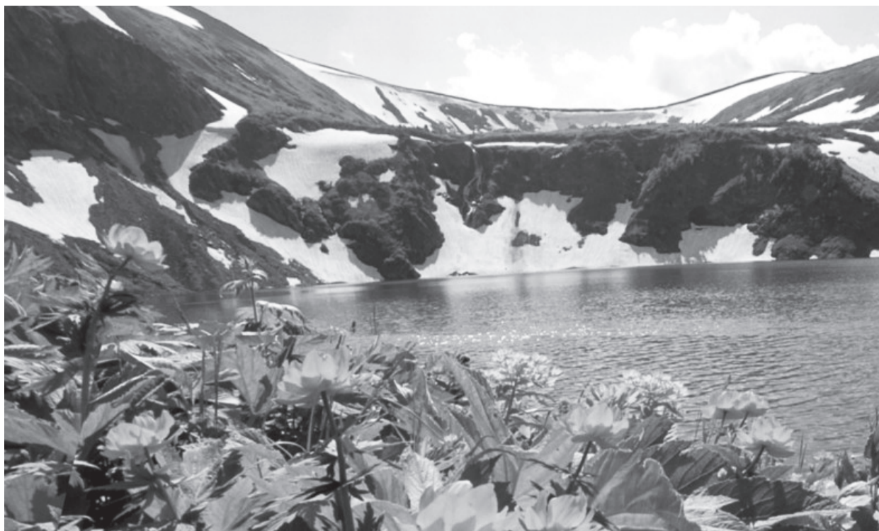
Ивановские озёра, с.Приискское