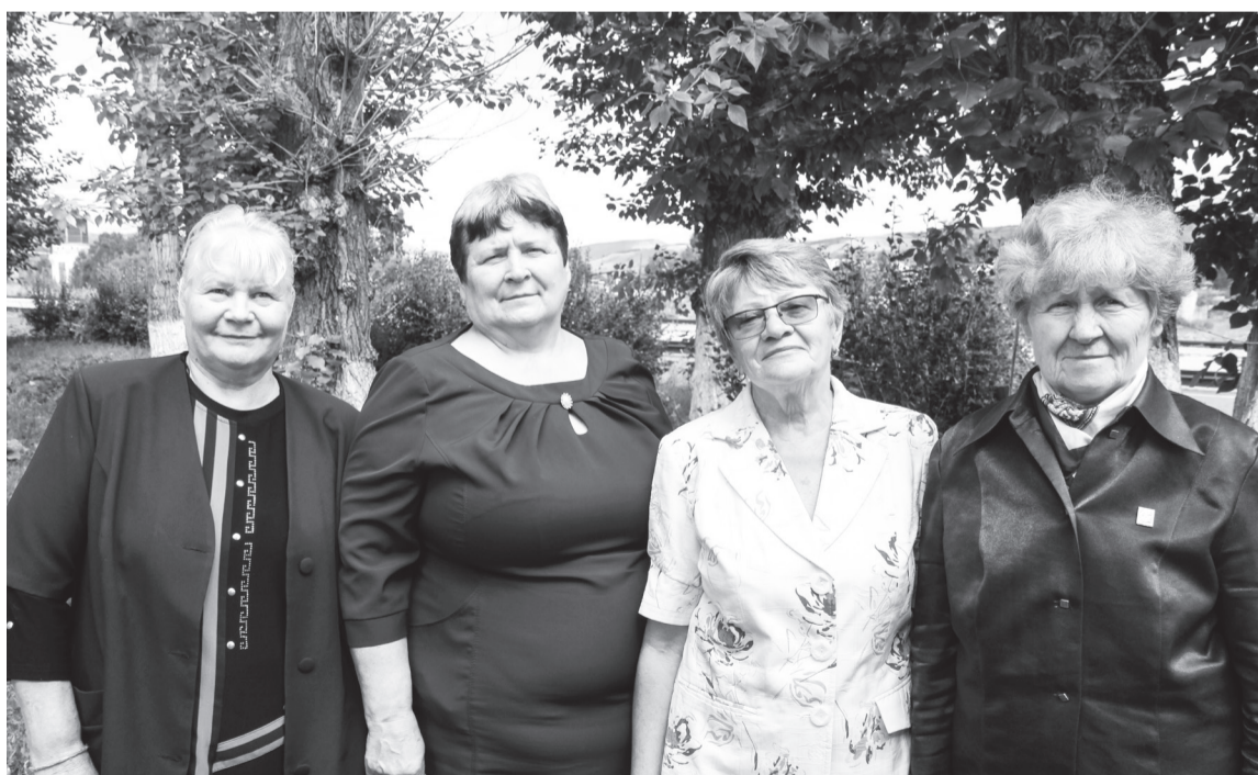
Этим милым женщинам до сих пор временами снится железная дорога. И не мудрено, ведь каждая из них отдала ей больше 30 лет своей жизни

У каждой из этих женщин тридцать и более лет трудового стажа на железной дороге. Долгое время их коллектив оставался стабильным, в работе надёжным, а в человеческом отношении дружным и весёлым. Позже, с небольшим интервалом, друг