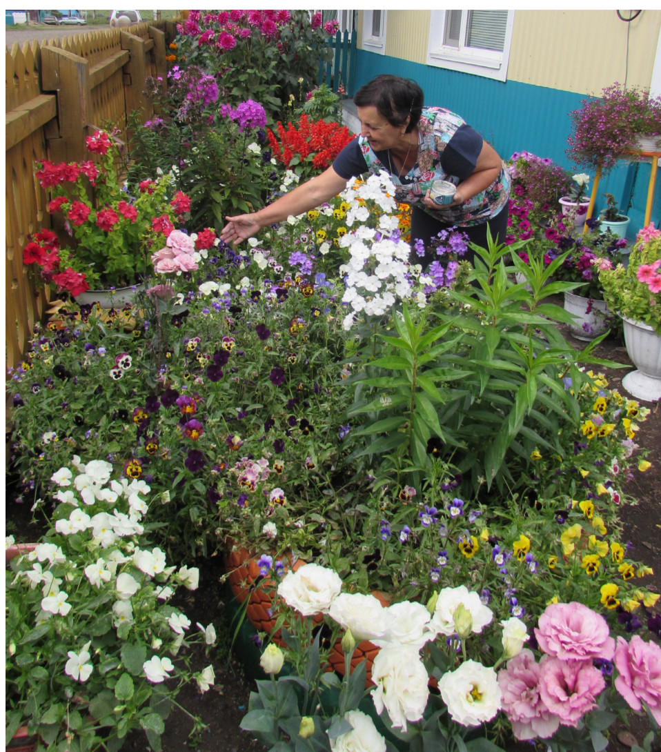
Если бы можно было передать словами, какая красота скрывается за многими заборами, просто сказка!