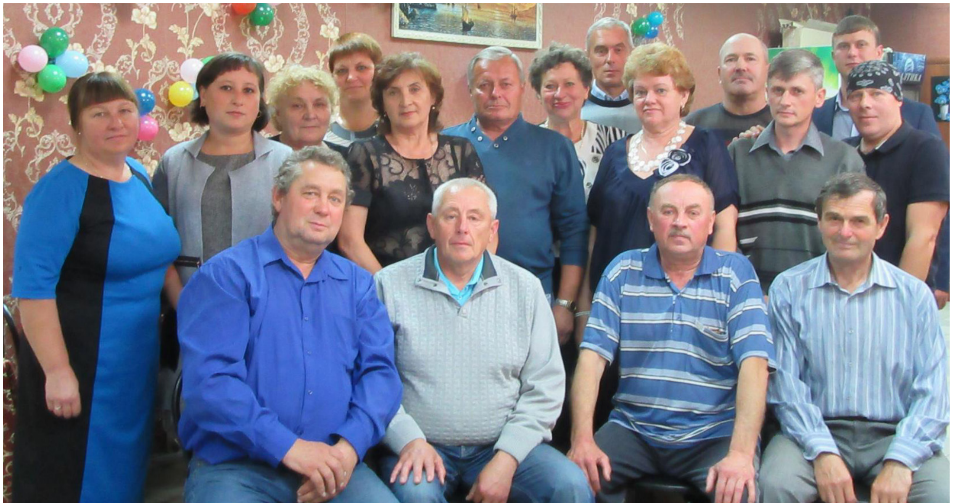
Тот редкий случай, когда коллектив лесников района практически в полном составе

В этом году у работников лесной отрасли, можно сказать, юбилей: 40 лет назад, в октябре 1980 года, была установлена дата праздника - День лесника.