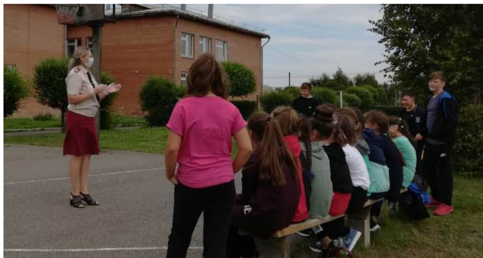
Урок прошёл на свежем воздухе