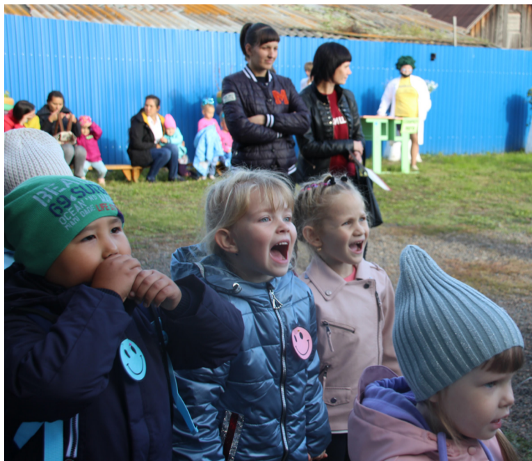
Праздник пришёлся детям по душе, они не сдерживали искренних эмоций

Сама природа благоволила к детям, их родителям и педагогам: несмотря на вечер, ярко светило солнце, было очень тепло и безветренно. Праздник проходил во дворе ДДТ и назывался «По секрету всему свету». Дом детских душ и сердец, как всегда, был гостеприимным и нарядным, красиво украшена была и уличная сцена, звучала весёлая детская музыка. Детвора всё подходила, а кто помладше и в первый раз, шли с родителями.