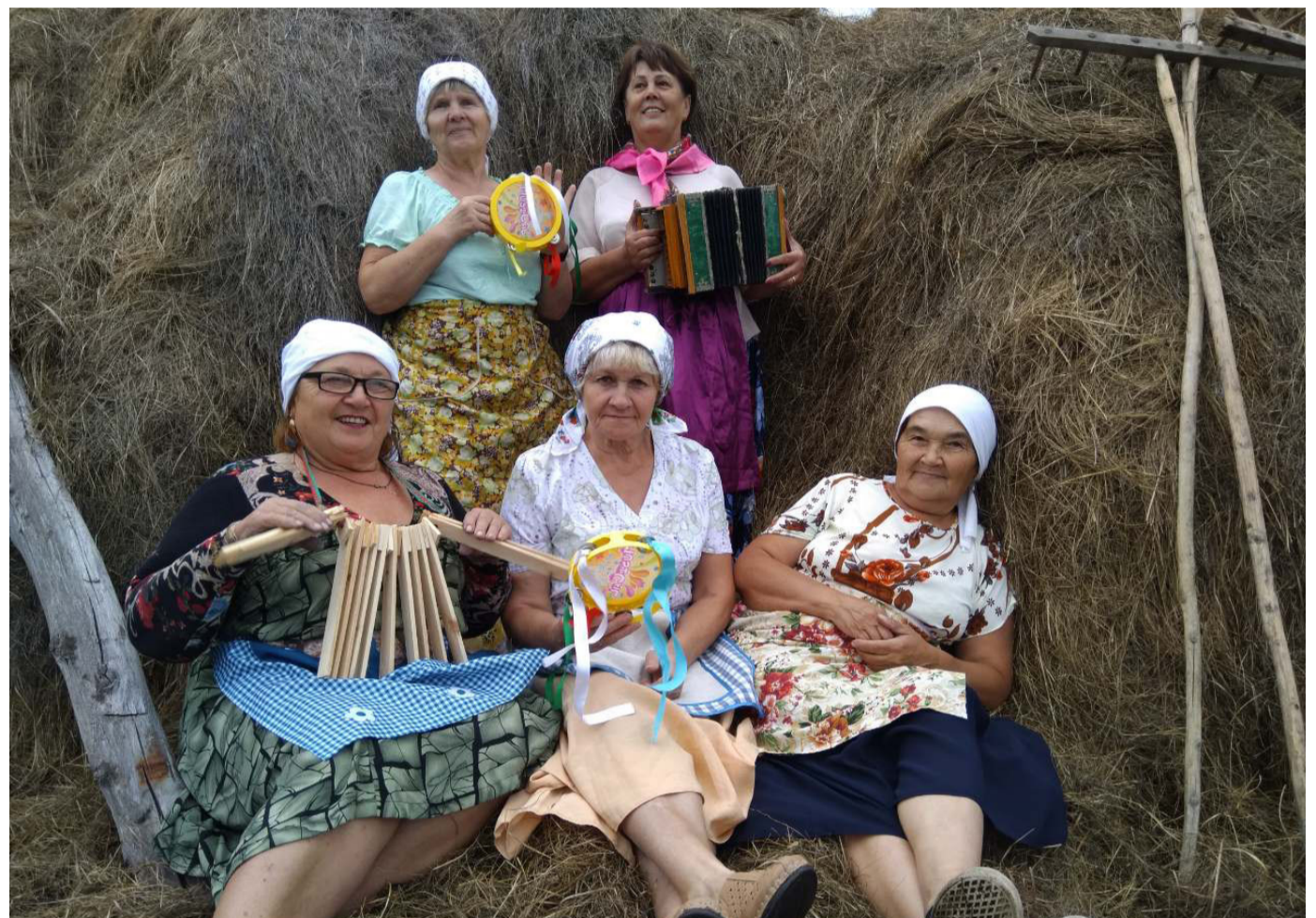
Фото – финалист фотоконкурса «Сено, солома», организованного Красноийским СДК. И хотя сеноуборка давно завершена, ароматные стожки и катушки ещё долго могут служить живописными локациями для фотосессий