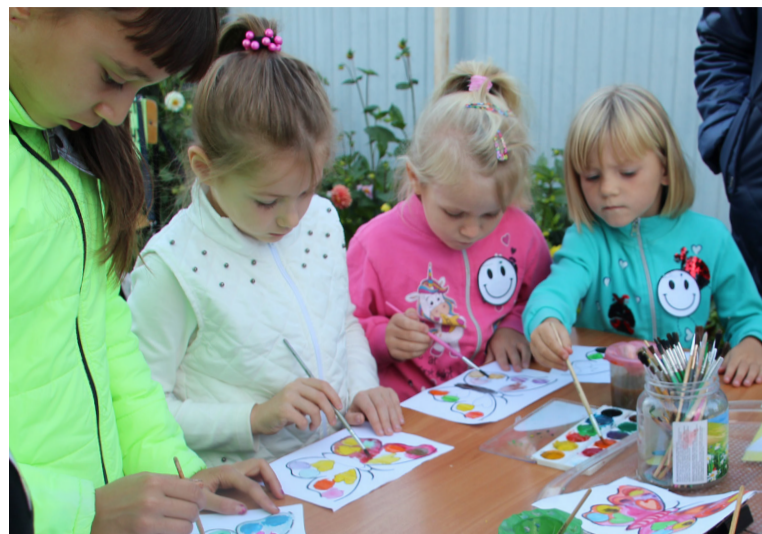
На площадке «Секреты разных цветов» кипела работа. С помощью красок юные творцы увлечённо превращали нарисованных бабочек в разноцветных и ярких