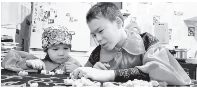
Интересная игра - хазых ойын - инвентарём для этой игры служат специально обработанные овечьи астрагалы

Помните, как весело мы проводили время всего каких-то 20 лет назад? И для этого нам совсем не надо было выходить в интернет. Помните те времена, когда абсолютно все дети вместе со взрослыми собирались большой шумной компанией и шли играть в лапту? А помните её правила? Играть можно на открытой местности, это командная игра с мячом и битой. Цель игры - ударом биты послать мяч как можно дальше и пробежать поочередно до противоположной стороны и обратно, не дав противнику «осалить» себя пойманным мячом. Вспомните, как мы собирались и дружной командой играли в волейбол или пионербол. А ещё была очень прико-