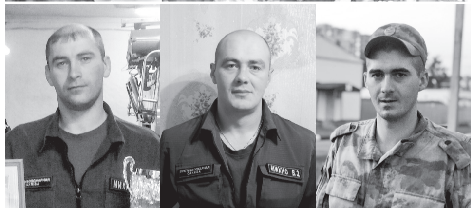
Вот оно, счастье матери - три парня, три сына