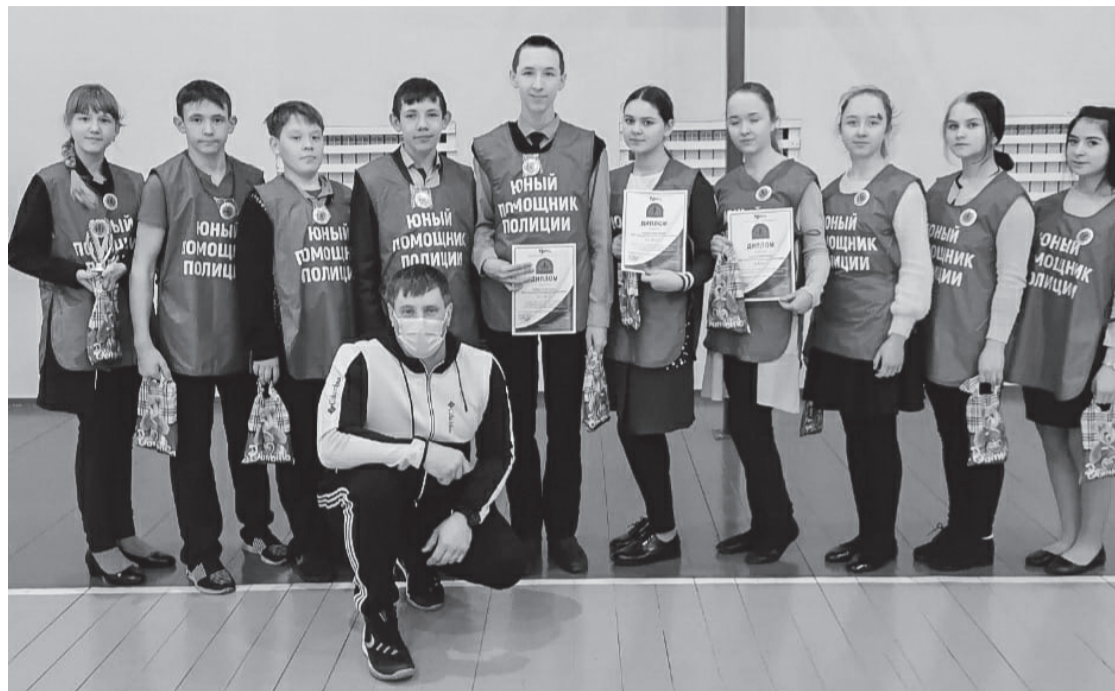
«Стражи порядка» из Июсской СОШ

Подведены итоги VII Республиканского Слёта юных помощников полиции, посвящённого Дню сотрудников органов внутренних дел и 75-летию Победы в Великой Отечественной войне 1941-1945 годов.