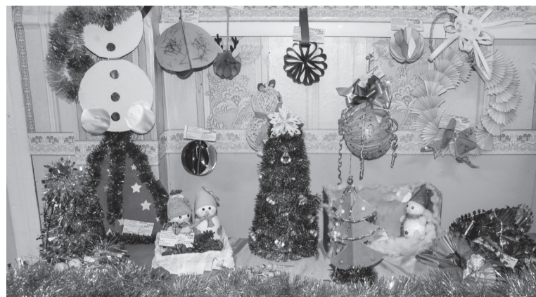
Новогодние поделки сделанные руками воспитанников ШРР «Радуга» и «Гармония»

ном новогодней мишурой столе можно увидеть ёлочки разных размеров и расцветок. Они сделаны из ленточек, разноцветной мишуры, бумаги, из бумажных помпонов. Украшенные бусами, шариками, бантами, снежинками, маленькими колокольчиками, звёздочками и даже сердечками. Верхушки многих венчает красная звезда. А сколько здесь снеговиков! Вязанные из ниток, сделанные из бумаги. У одних на голове красивые яркие колпачки, у других – украшенное маленькими снежинками ведёрко. Все они с большими ртами, растянутыми в добродушной улыбке. Ещё здесь можно увидеть разноцветные шары, звёздочки, новогодний венок из бумаги яркого цвета, настоящие сосновые шишки, блестящий домик, как-будто покрытый белым инеем, и кажется, что из его трубы вот-вот тонкой струйкой пойдёт дымок, тут же – косялый мишка, который только и ждёт, когда его поместят на ёлочку. Можно увидеть здесь и несколько зимних новогодних композиций. И, конечно, не обошлось без символа будущего