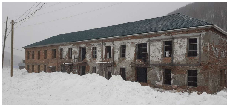
В этом разрушенном здании с трудом можно узнать когда-то красивый цветущий детский сад

В 2013 году решением Совета депутатов оно было списано и практически сразу же куплено «Красноярским Загорьем» (кто не знает, это санаторий). Вот и у нас было решено сделать зданию. Приехали рабочие, стали восстанавливать здание. Окна и двери, сияющие пустотой, затянули полиэтиленом. Накрыли крышу. Потом работники уехали, и на этом всё — до остального дело так и не дошло. Почему не стали далее выполнять работы по восстановлению, не понятно.