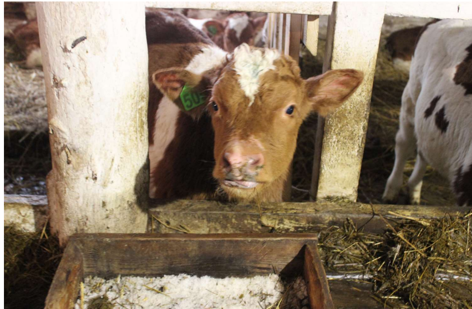
На ферме проживает 225 бурёнок, плюс 400 голов молодняка

Мирно посапывали или стояли в своих загорах и с любопытством смотрели на гостей телятки. Одна из телятниц шустро орудовала вилами, раскладывая по кормушкам душистое сено. В коровнике завершили дойку и готовились выпустить бурёнок на дневную прогулку. А их – 225 голов, да плюс 400 голов молодняка. Когда-то (да не так уж и давно) здесь было в разы больше коров и молодняка КРС. В планах руководства – увеличение поголовья дойного стада. Условия и возможности для этого имеются. Нынче будет ремонтироваться второй