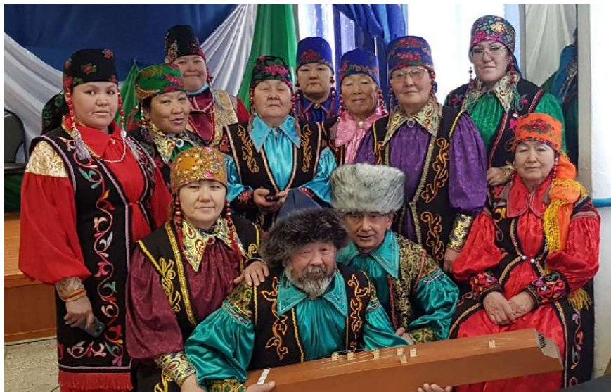
Хор «Чазы Уннери» перед прослушиванием