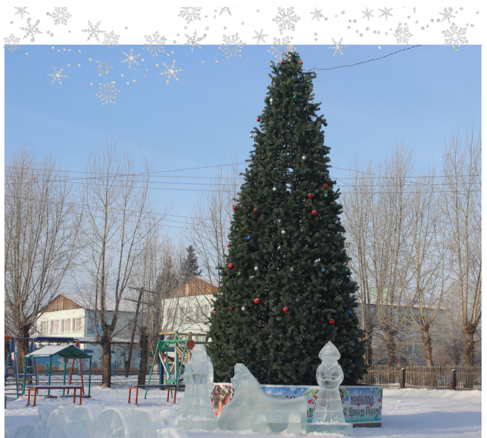
Главная ёлка района

- самая дорогая ёлка была установлена в 2010 году в г.Абу-Даби (ОАЭ), она была украшена золотыми и серебряными шарами, а также ювелирными изделиями с драгоценными камнями на общую сумму 11,5 млн долларов; - в г.Риме (Италия) ёлку устанавливают на площади Святого Петра. Согласно сложившемуся обычаю, каждый год «рождественское дерево» Ватикану приносит в дар одно из европейских государств. Эта традиция была введена Ио-