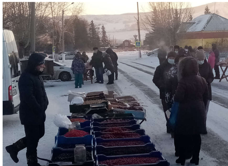
Народ на ярмарке гулял, мороз на пятки наступал

Тех же, кто не смог прийти, УКМС района информировало, что они могут подойти в Управление и получить там причитающиеся им призы. Интрига была в том, кому же посчастливится стать обладателем главного приза – живого большого барана.