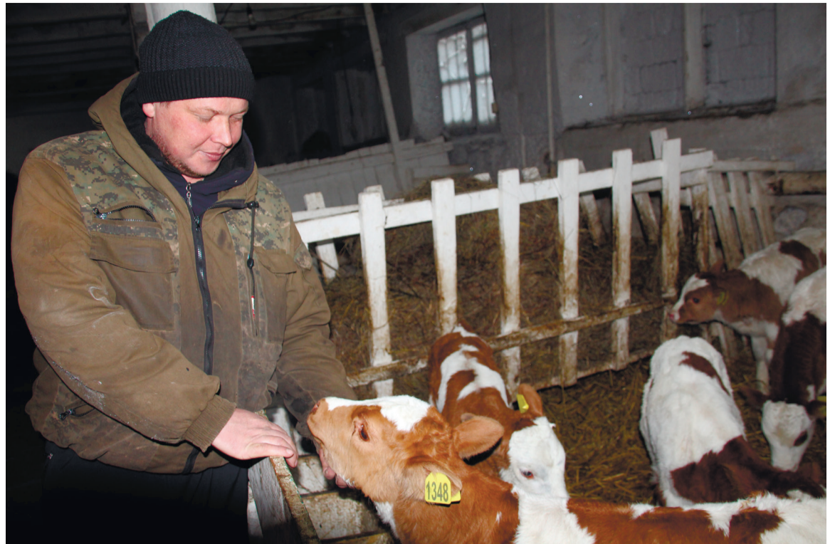
Молодой фермер на трудности не жалуется, а стремится преодолеть их

Хотя и преобладает на базе ручной труд (раздача кормов, дойка, чистка), без механизации тоже не обойтись. А значит, нужна постоянная заправка для