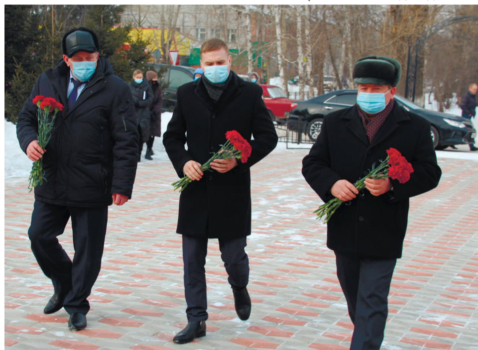
Главы республики, района и п.Копьёво возложили цветы к памятнику Павшим