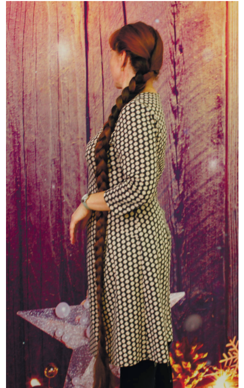
Коса до пят - такая редкость в наши дни!

В те времена девушки и женщины не стремились подстригать свои волосы. Но иногда это имело место быть. Например, если девушка решила принять монашеский постриг. А иногда перед свадьбой в некоторых местах девушке остригали косу и дарили её жениху, что служило доказательством невинности, но потом после свадьбы женщина опять отращивала