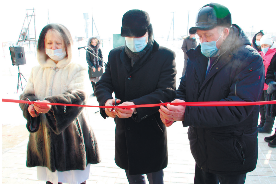
Глава региона принял участие в торжественном открытии ФАПа в д.Подкамень