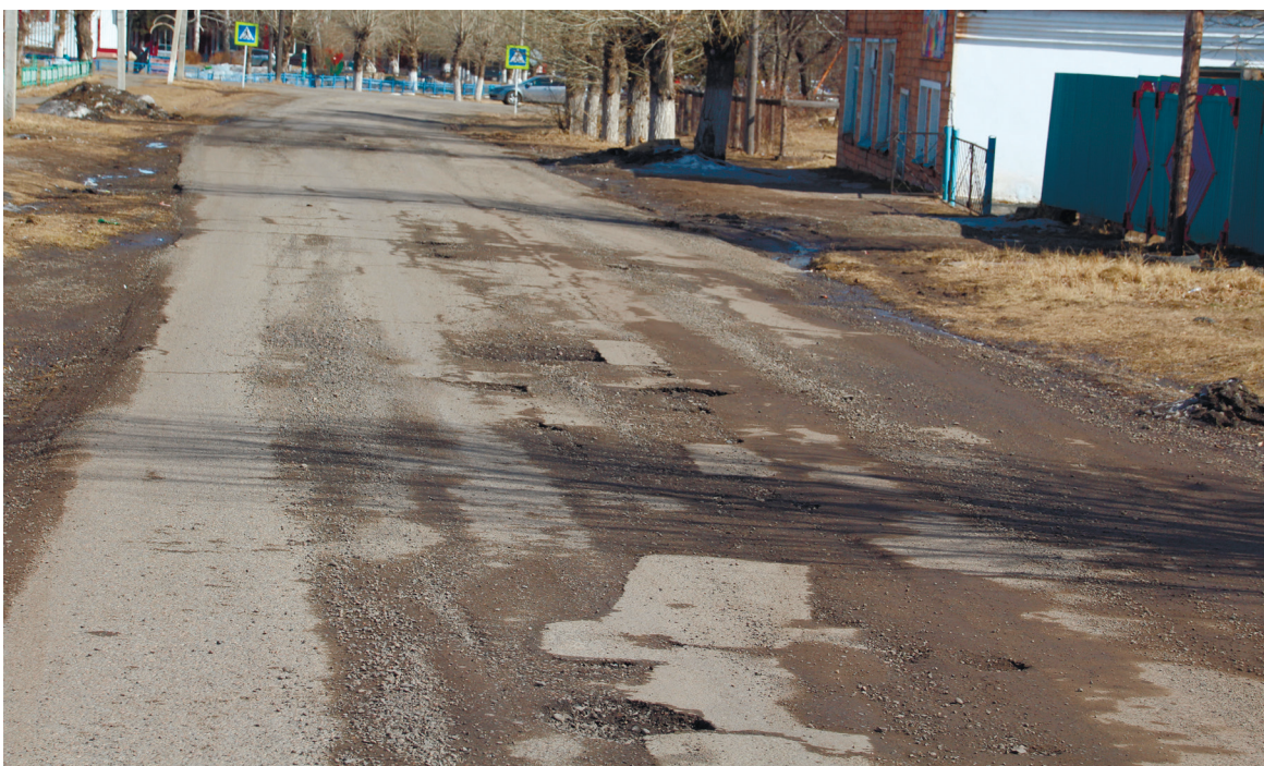
Мороз: «Мне надо уходить». Снег: «Мне тоже»... Асфальт: «Подождите, я с вами!»

Бригада поссовета всё время в работе: обустроиваем площадки под мусорные баки, делаем дорожную разметку и устанавливаем знаки. Лёд скальвали на пешеходных дорожках. Земля подсыхает – следом идёт уборка мусора в аллеях и парках, на кладбищах. Все ра-