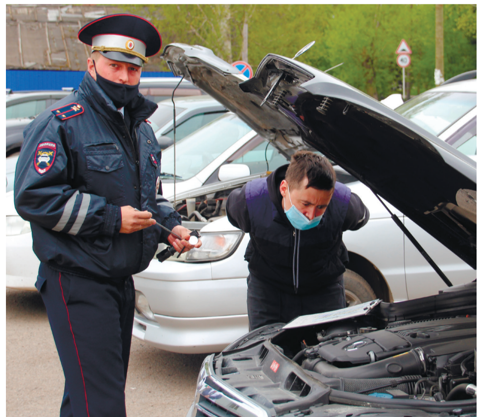
Осмотр автомобиля: где же номер двигателя тут найти?

- установка колёс большего радиуса, размерность которых не предусмотрена автопроизводителем, должна быть ис-