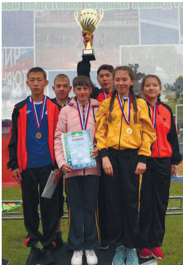
Учащиеся МБОУ «Устино-Копьёвская СОШ»