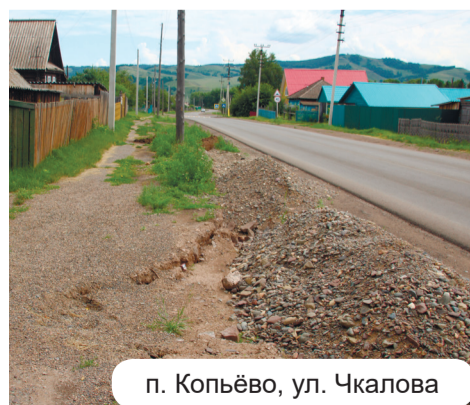
п. Копьёво, ул. Чкалова

А дел то – трубу метров пять длинной положить на старое место. Уж сколько в поссовет обращался по этому поводу! И трубы асбоцементные у них есть. Да только, видно, не на нашу улицу. Вот сделали участок асфальта до гостиницы по улице Речной – хорошо. А чем хуже мы, кто ниже гостиницы по улице живёт?