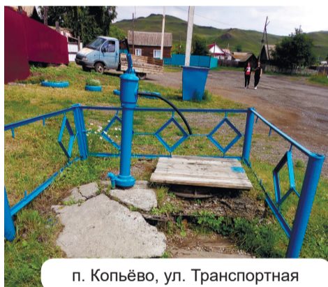
п. Копьёво, ул. Транспортная

А зачем лишние усилия? Себе благо сделали, а об остальном пусть думают те, кто колонкой пользуется, или ЖКХ. Хотя при получении разрешения на производство земляных работ все подписывали договор, в котором, наряду с прочим, приведение в порядок нарушенной территории предусматривалось. Но это ещё не всё. Следующий «человеческий фактор» – окурки и мусор, иногда целыми пакетами выгружаемый владельцами и пассажирами проезжающих автомашин. Удобно: набрали жарким летним днём холодненькой водички, заодно из салона лишнее убрали