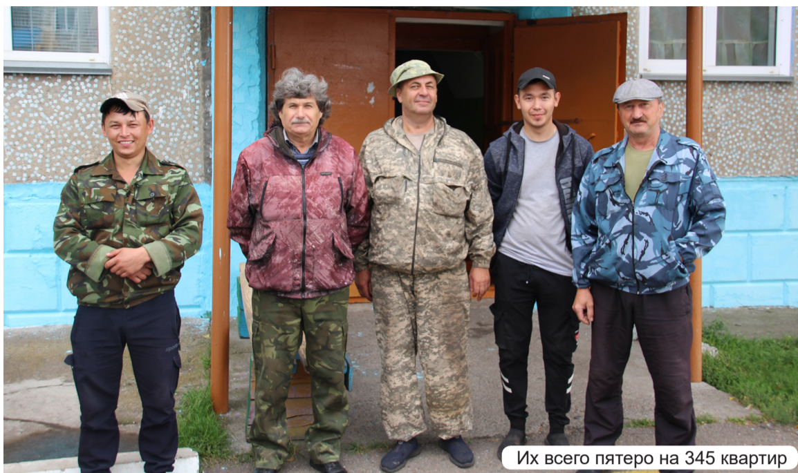
Их всего пятеро на 345 квартир

- Да, жильцы оплачивают коммунальные услуги, отсюда средства расходуются на обслуживание и текущий ремонт. Отдельные взносы на капремонт идут в Республиканский фонд капитального ремонта многоквартирных домов. Этот