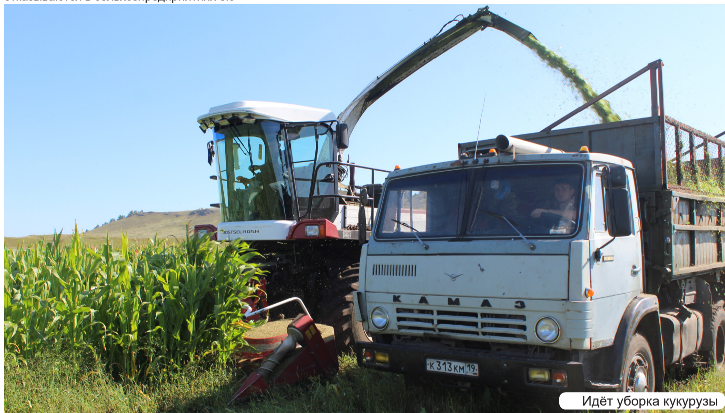
Идёт уборка кукурузы

заниматься: канители и вложений немало, а если что пойдёт «не так» (холодная весна, засушливое лето, ещё какие «сюрпризы» погоды), осенью можешь и без урожая остаться.