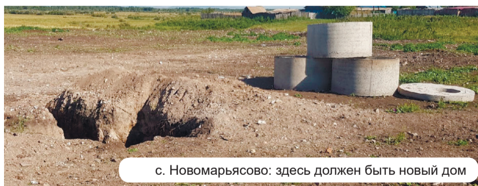
с. Новомарьясово: здесь должен быть новый дом

оны раз за разом срываются. И другое, когда подрядчикам, взявшимся в эти стройки, приходится выкручиваться, буквально выворачивая свои карманы: отступать уже некуда.