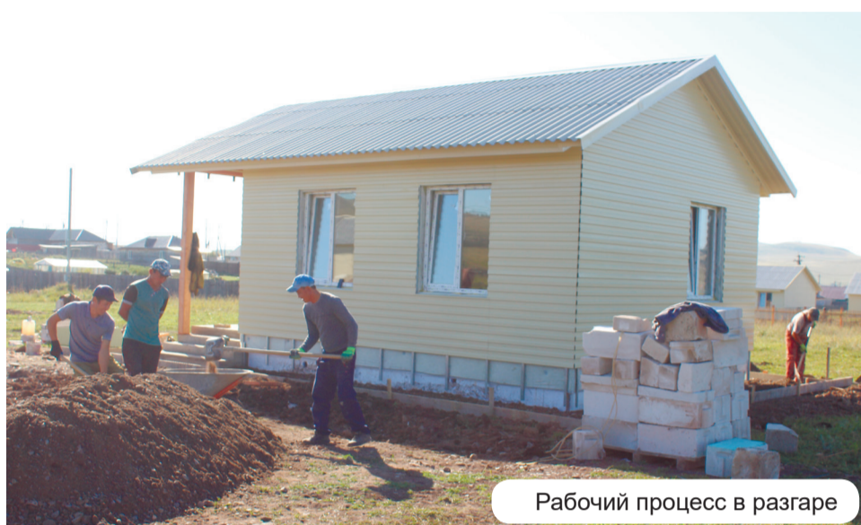
Рабочий процесс в разгаре

Но в нашем случае – не всё так однозначно. Ведь все же слышаны, да и СМИ об этом пишут, с какой проблемой нынче пришлось столкнуться и подрядчикам, и заказчикам бюджетных строений в масштабах всей страны. Не исключение и наша республика. С начала года цены на строительные материалы и металл взметнулись беспредельно высоко. В результате «припылили»: средств, предусмотренных сметами на стройки и ремонты по ценам годичной давности, катастрофически не хватает. Но объекты нужно строить. И одно дело, когда подрядчики просто не заявляются и аукци-