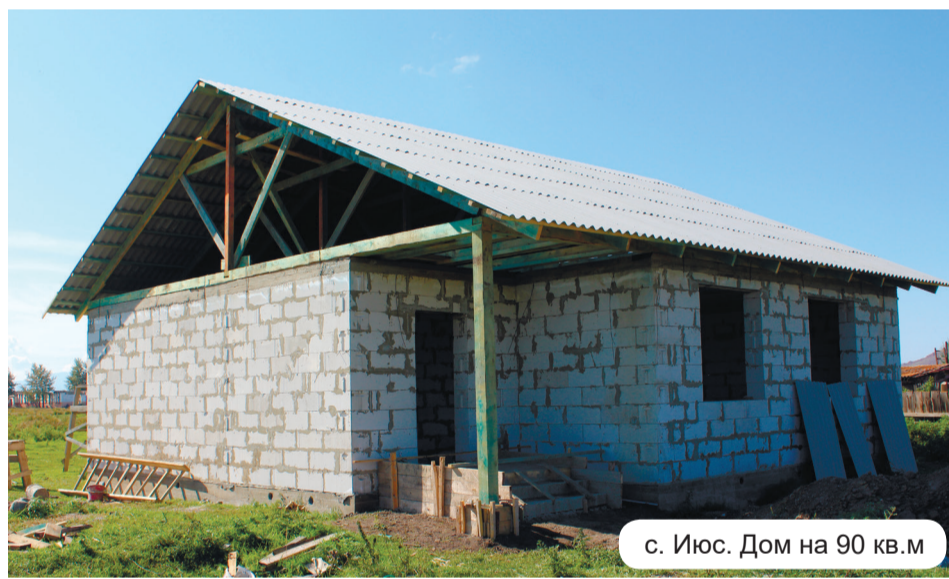
с. Июс. Дом на 90 кв.м