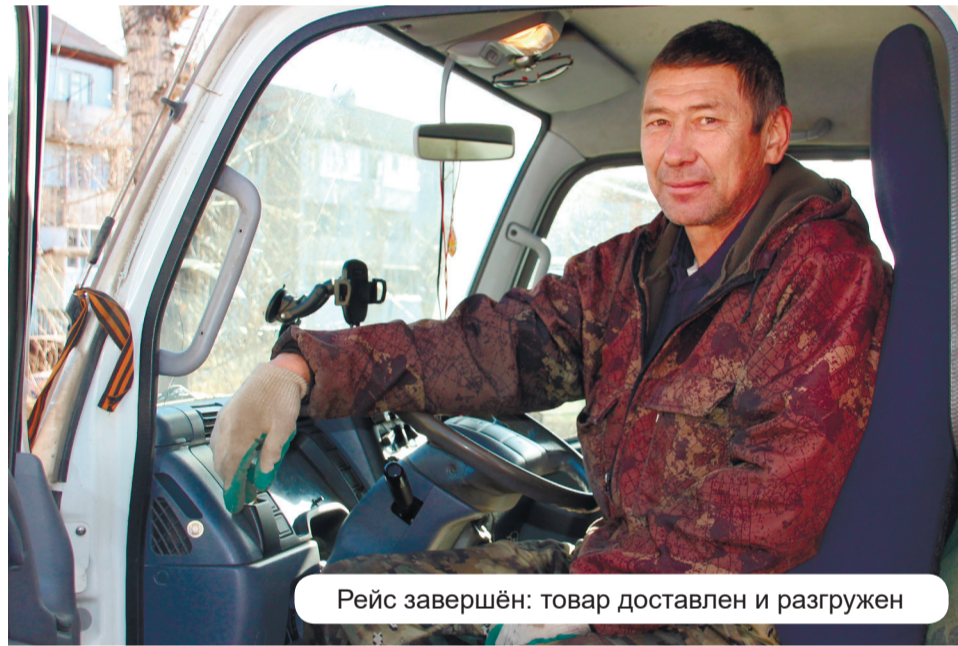
Рейс завершён: товар доставлен и разгружен

- На посту госавтоинспекции останавливают, делают распечатку с «Тахографа», а там всё: километраж общий, сколько проехал без остановок, сколько стоянок. Такая длинная лента бумаги вылезает, а постов хватает. В Иркутске стационарного поста нет, а в деревнях и городах Иркутской области патрули. В Слюдянке уже есть пост, в Бурятии и