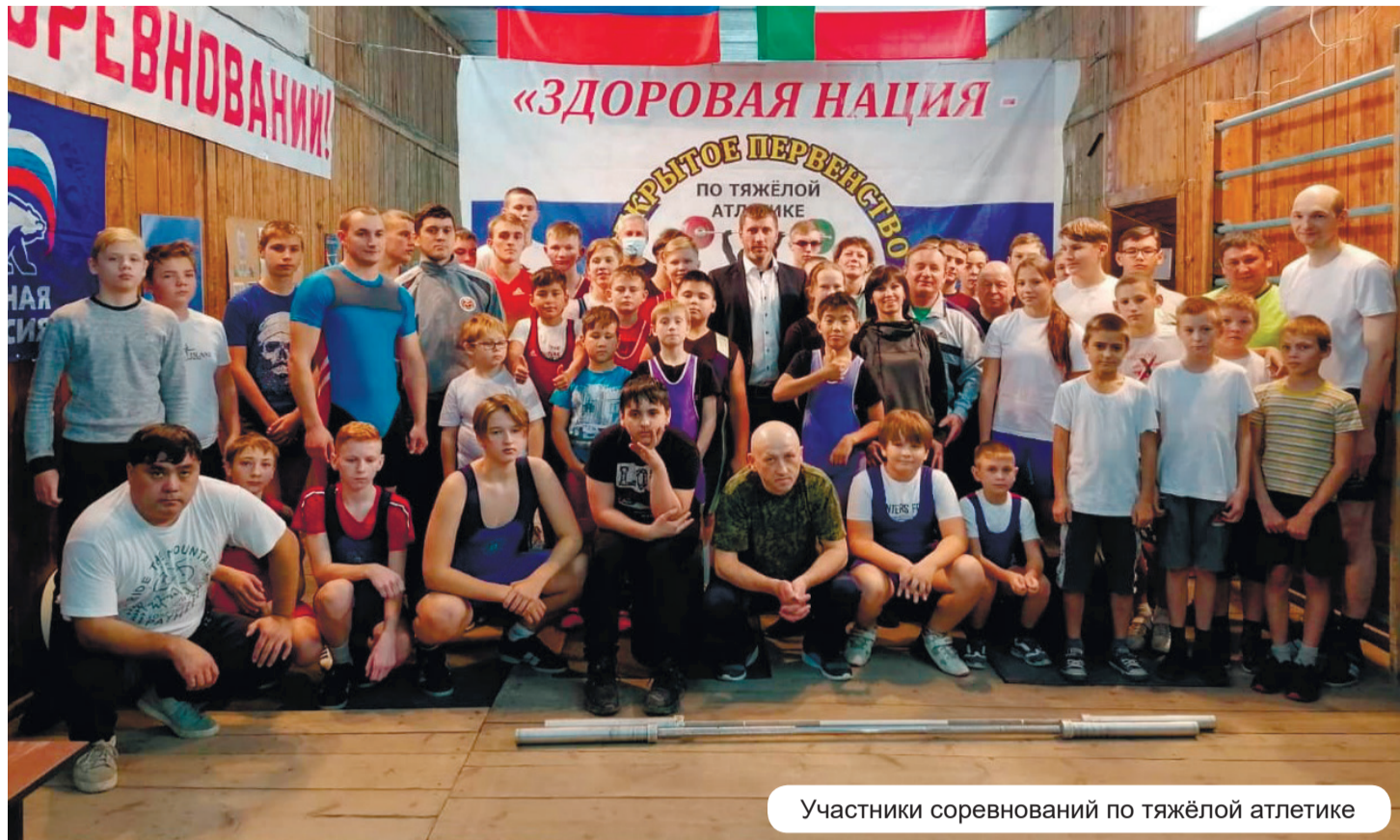
Участники соревнований по тяжёлой атлетике