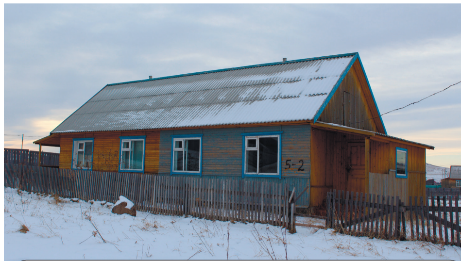
Брошенные дома для детей-сирот представляют собой удручающее зрелище. Где вы, закреплённые за ними хозяева?

Многие копьёвцы тут же напомнят про квартал новостроек (ул. Луговая, Полевая, Мира и другие), где на каждом шагу встречаются брошенные, заросшие бурьяном «сиротские» дома, в которых уже лет 7-10 никто не живёт. В с. Устинкино так прямо на въезде в село сразу цепляется растерзанный двухквартирный дом, который десять лет назад тоже был построен для сирот. И где же они? Скидываются по России-матушке бог весть где при имеющемся закреплённом за ними жильё. Зачем просили-выхаживали по судам, коли не собирались в этих квартирах жить и бросили их, не доведя до ума? Другие вот, наоборот, ждут - не дождутся своих заветных «квадратов». Конечно, не факт, что спустя непродолжительное время они тоже не бросят халаянное жильё. Но таков уж закон, что ни изъять, ни передать другим нуждающимся невозможно: оно же закреплено за конкретным сиротой. И чуть что, начнётся писанина по инстанциям: «обижают», «ущемляют». Но больно смотреть на брошенные дома, которые другим послужили бы верой и правдой, молодым специалистам, например. Да любому хозяйственному молодому человеку дай такую квартиру из пустующих, он бы из неё со временем конфетку сделал, и огород бы разработал, и засаживал его картофелем-овощами, и стаюшки-сараюшки, а то и гараж бы