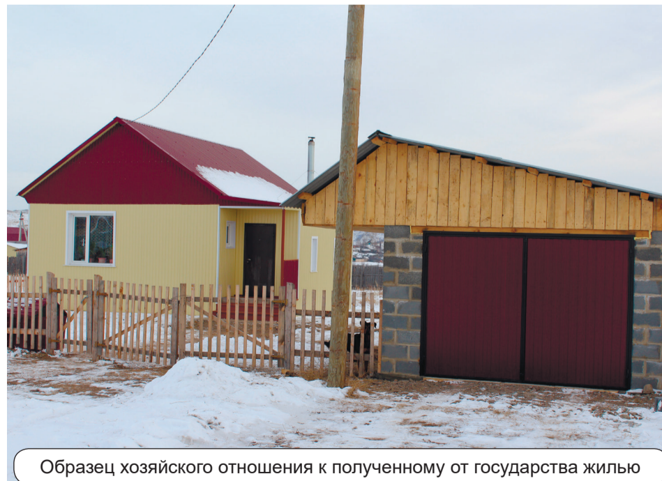
Образец хозяйского отношения к полученному от государства жилью

появились безо всяких «вы мне должны и обязаны». Хотя справедливости ради надо сказать, что есть такие молодые люди из числа сирот, чьи дома радуют глаз ухоженностью и порядком. Однако у большинства домов, в коих живут си-