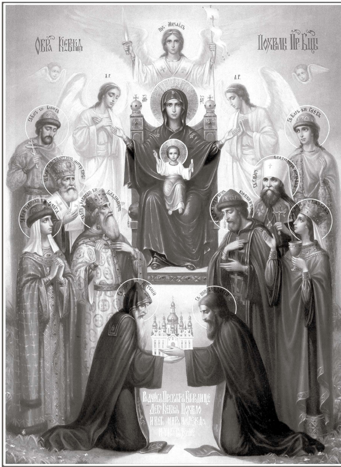
Икона Похвала Пресвятой Богородицы

14 октября – Покров Пресвятой Богородицы