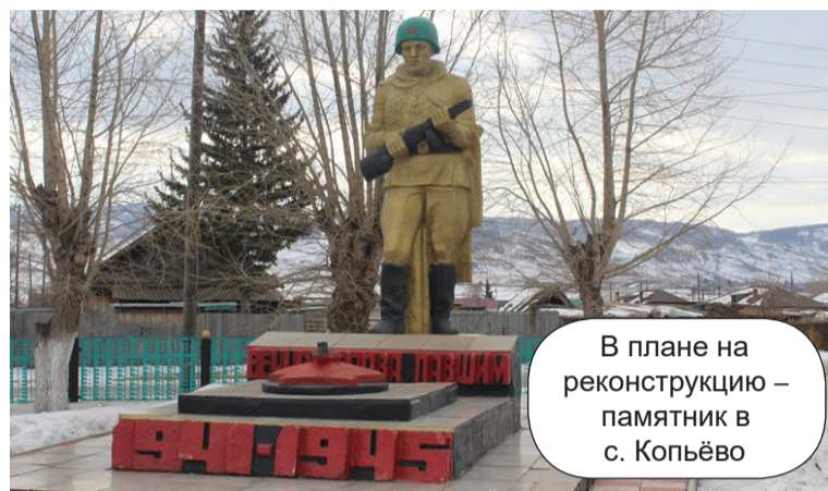
В плане на реконструкцию – памятник в с. Копьёво

министрации и ЖКХ. Площадки могли бы содержать территориальные общественные самоуправления (ТОСы) – это в интересах местных жителей, ведь ТОС тоже может получить грант на благоустройство. Но пока, в отличие от посёлка Копьёво, такие объединения самоуправления на территории Копьёвского сельсовета не созданы.