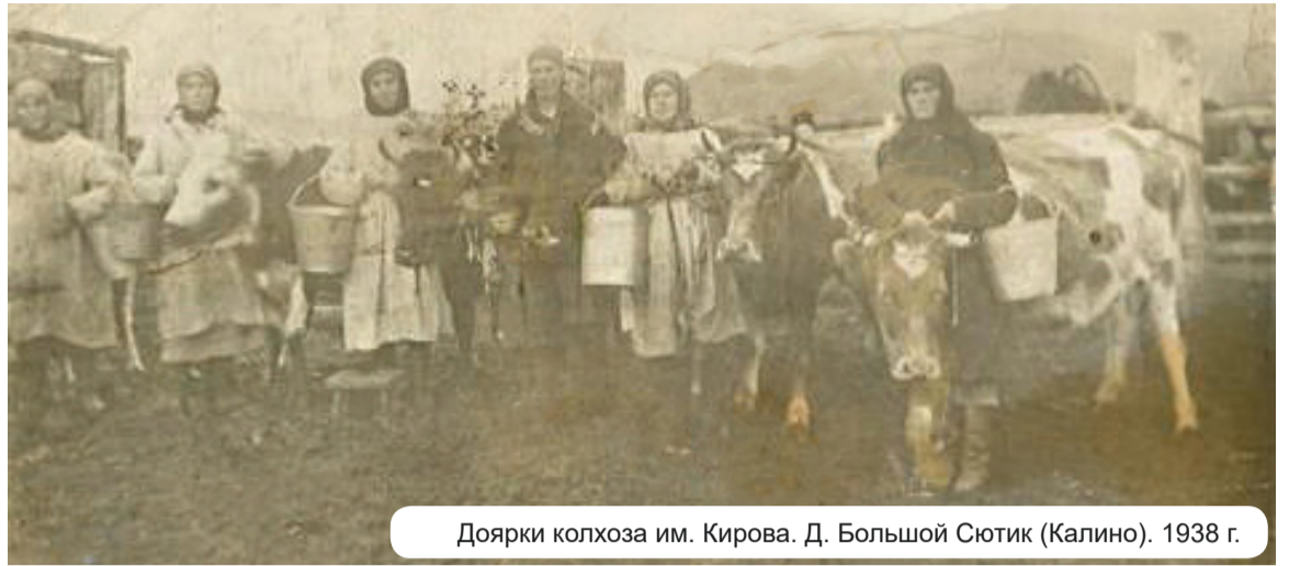
Доярки колхоза им. Кирова. Д. Большой Сютик (Калино). 1938 г.

В д. Б.-Сютик и д. М.-Сютик по Сютикскому сельсовету за 1930 год была организована артель «Юный труженик», был