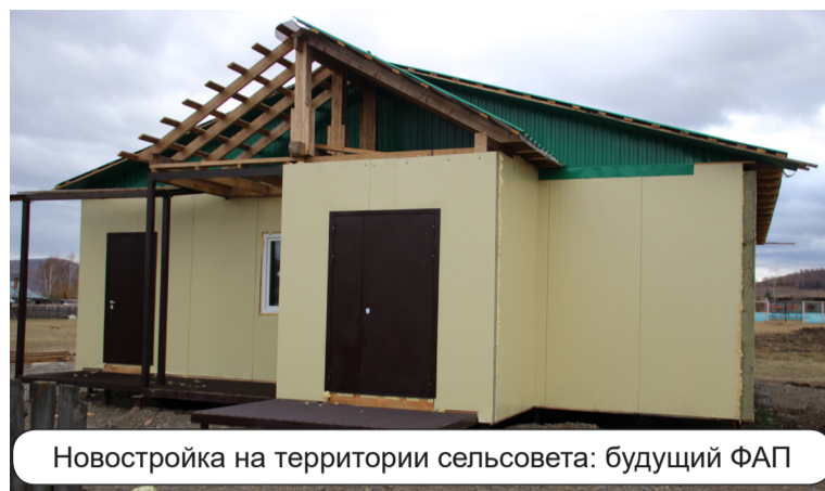
Новостройка на территории сельсовета: будущий ФАП

- Произвели собственными силами. Уличное световое оборудование выбирали тщательно – подсчитали, что выгоднее купить светильники более качественные, с мощным блоком защиты, зато прослужат они долгий срок и меньше будет затрат с обслуживанием в дальнейшем. Те же спортивные и детские площадки необходимо регулярно белить, красить, чинить. Но их всё-таки можно по пальцам пересчитать, а уличных фонарей уже под сотню, и надо дальше проводить реконструкцию уличного освещения в селе Копьёво, Большом Сюттике и Малом. И всё это – силами работников ад-