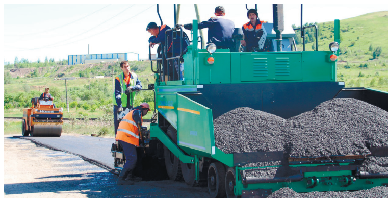
21 апреля 1967 года – день рождения Орджоникидзевского ДРСУ (ПДУ).