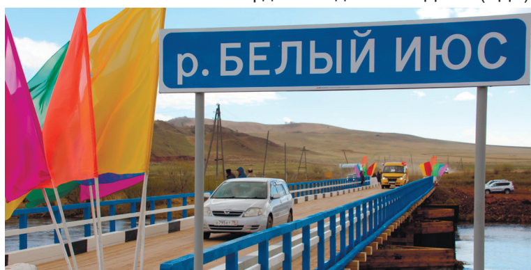
Торжественное открытие моста через реку Белый Июс 7 мая 2017 года