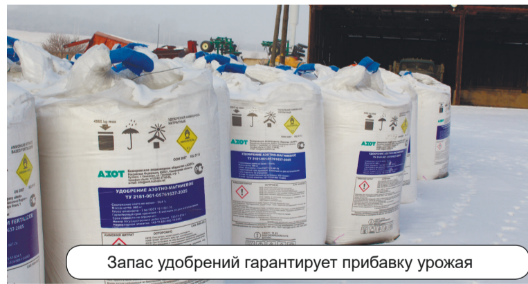
Запас удобрений гарантирует прибавку урожая

Поддержка эта в свете растущих цен придётся очень кстати. Если дизтопливо подорожало за последний месяц на 9%, химические средства защиты растений на 30-50%, то запчастки к сельхозтехнике выступили просто лидерами «ценооблома» – это 70, 120 и даже более 200