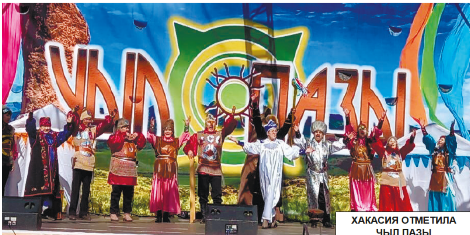
ХАКАСИЯ ОТМЕТИЛА ЧЫЛ ПАЗЫ