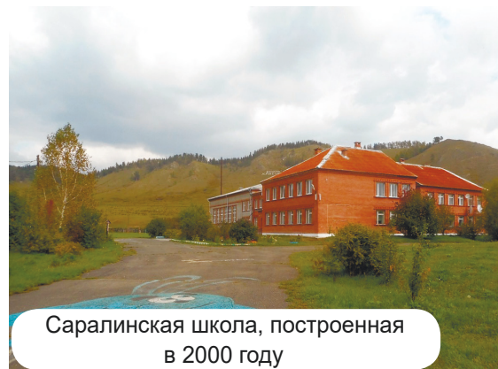
Саралинская школа, построенная в 2000 году