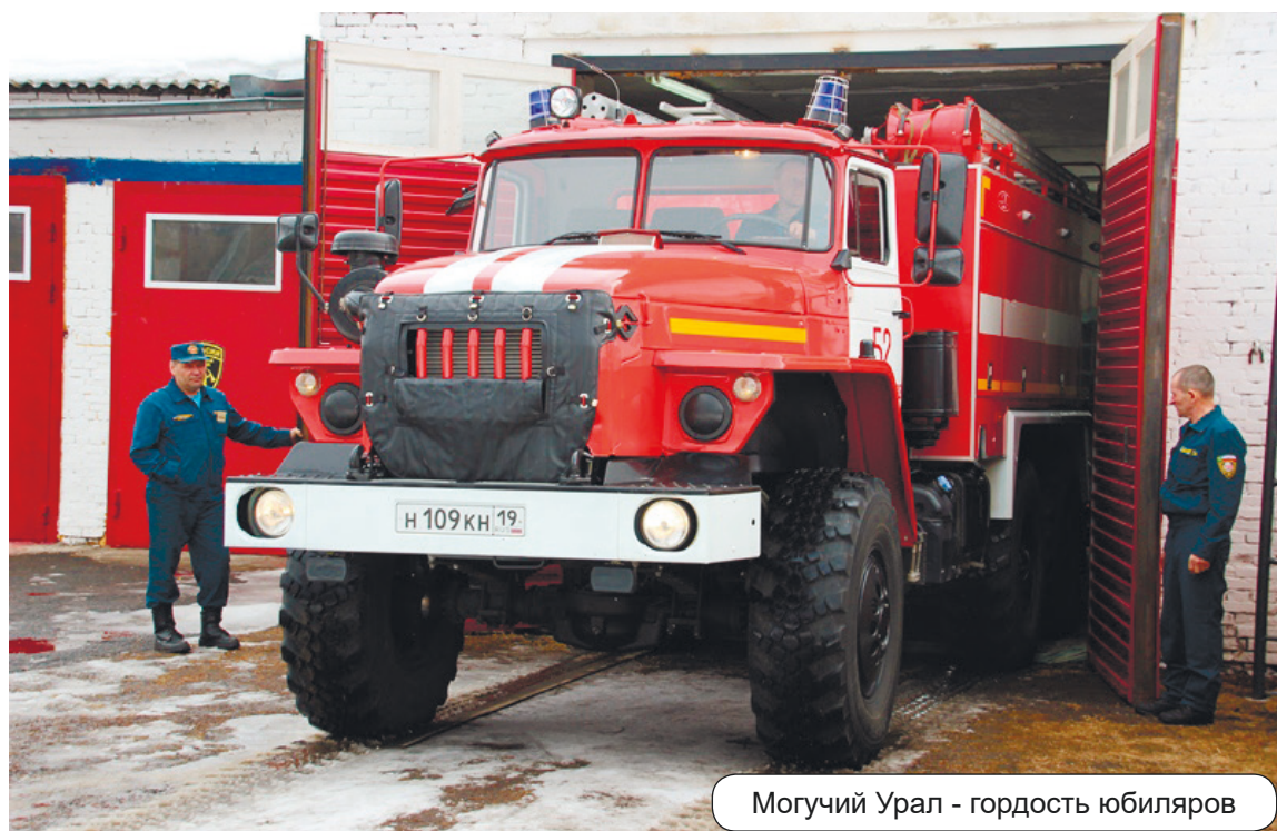
Могучий Урал - гордость юбиляров