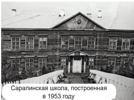
Саралинская школа, построенная в 1953 году