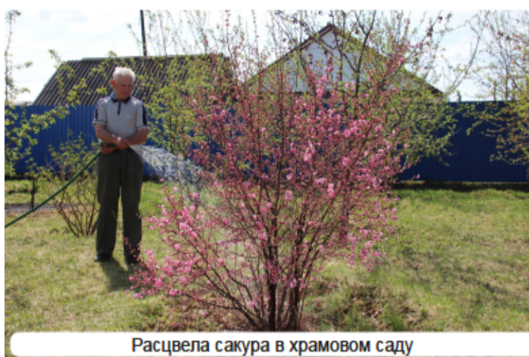
Расцвела сакура в храмовом саду

Органическое удобрение в виде свежего навоза можно вносить только на паровом поле или участке, при этом заделывать его в почву необходимо в течение полусуток, иначе весь имеющийся немногочисленный азот просто испарится в атмосферу – вонь будет стоять несусветная, а вот полезных питательных веществ расте-