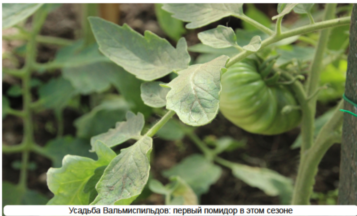
Усадьба Вальмиспилдов: первый помидор в этом сезоне

На суд жюри представляются самые крупные, прямо