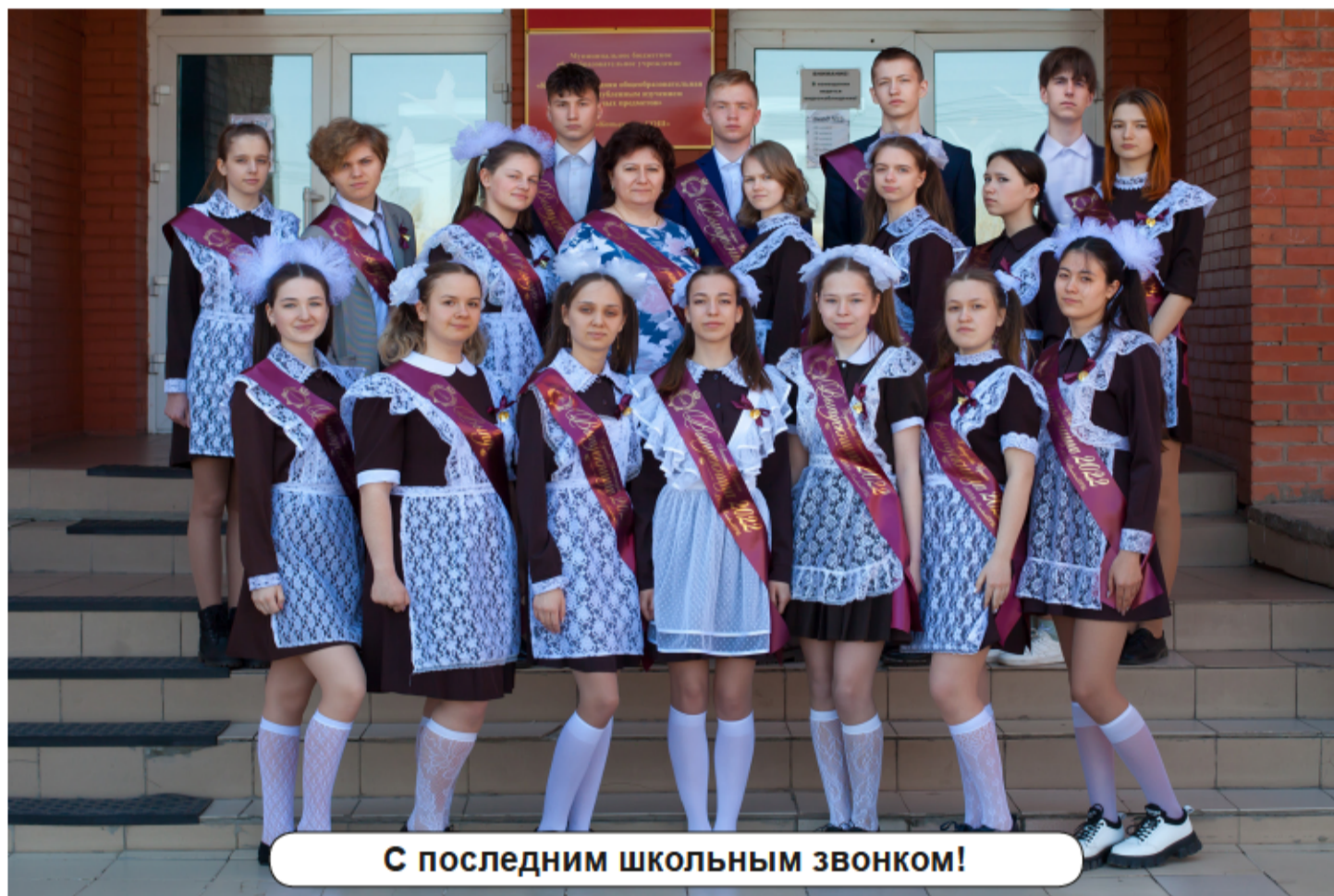
С последним школьным звонком!