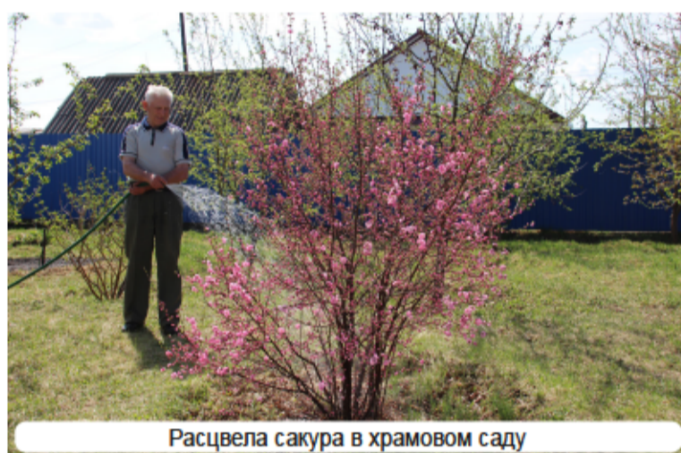
Расцвела сакура в храмовом саду

Органическое удобрение в виде свежего навоза можно вносить только на паровом поле или участке, при этом заделывать его в почву необходимо в течение полусуток, иначе весь имеющийся немногочисленный азот просто испарится в атмосферу – вонь будет стоять несусветная, а вот полезных питательных веществ расте-