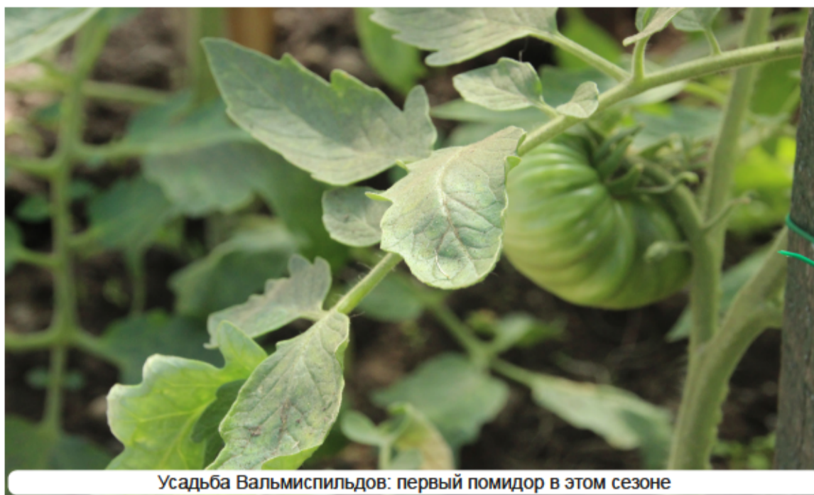
Усадьба Вальмиспилдов: первый помидор в этом сезоне

На суд жюри представляются самые крупные, прямо