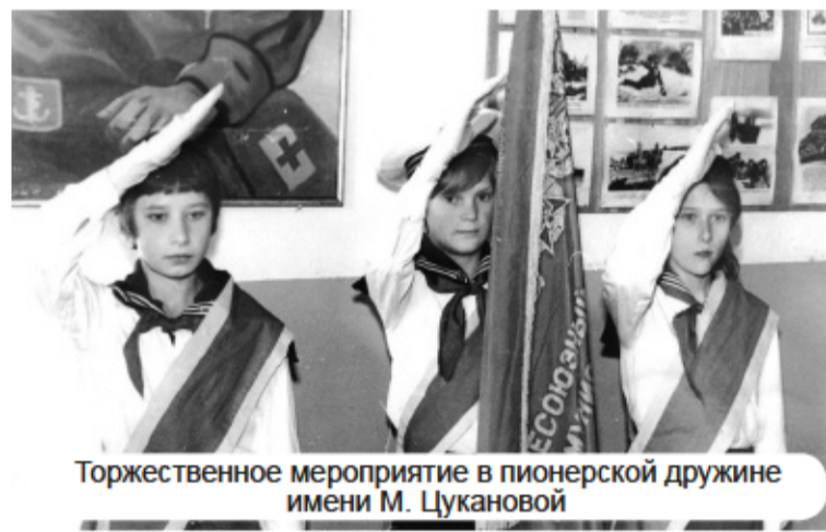
Торжественное мероприятие в пионерской дружине имени М. Цукановой

тивное участие в соревновании приняли учащиеся Когунекской семилетней школы, которые собрали и продали государству 1012 яиц и были награждены похвальным листом райкома комсомола.