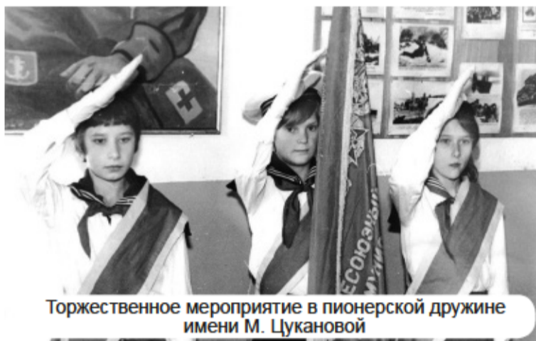
Торжественное мероприятие в пионерской дружине имени М. Цукановой

тивное участие в соревновании приняли учащиеся Когунекской семилетней школы, которые собрали и продали государству 1012 яиц и были награждены похвальным листом райкома комсомола.