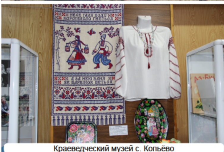
Краеведческий музей с. Копьёво

п. Копьёво – Сарала – Приисковое, у подножия горы «Пичиктиг-Таг», что в переводе с хакасского языка означает «Писаная гора», был открыт ещё один музей-заповедник под открытым небом – «Сулеки», или Сулекская писаница. Многочисленные рисунки здесь выполнены за счёт удаления части скальной поверхности, и называются они петроглифами.