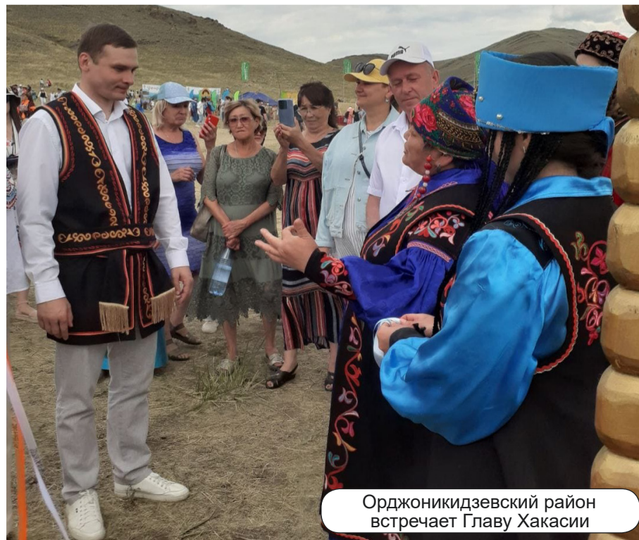
Орджоникидзевский район встречает Главу Хакасии