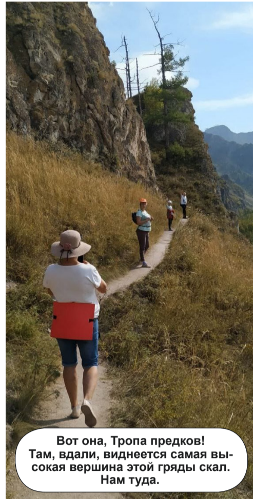
Вот она, Тропа предков! Там, вдали, виднеется самая высокая вершина этой гряды скал. Нам туда.