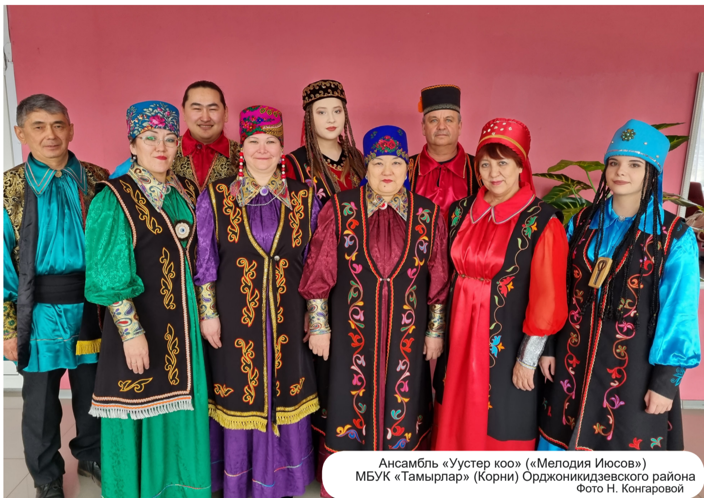
Ансамбль «Уустер коо» («Мелодия Июсов») МБУК «Тамырлар» (Корни) Орджоникидзевского района