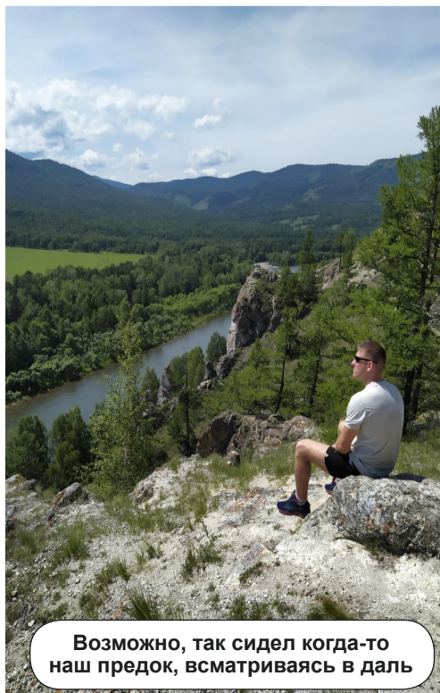
Возможно, так сидел когда-то наш предок, всматриваясь в даль