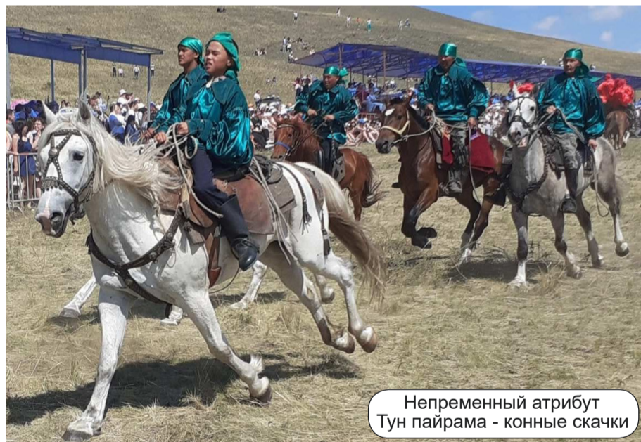
Непременный атрибут Тун пайрама - конные скачки