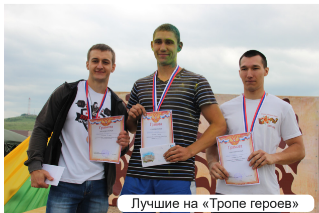
Лучшие на «Тропе героев»