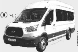
Лицензия № АК-24-001943 от 16.07.2019