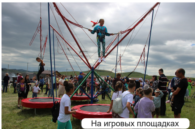
На игровых площадках