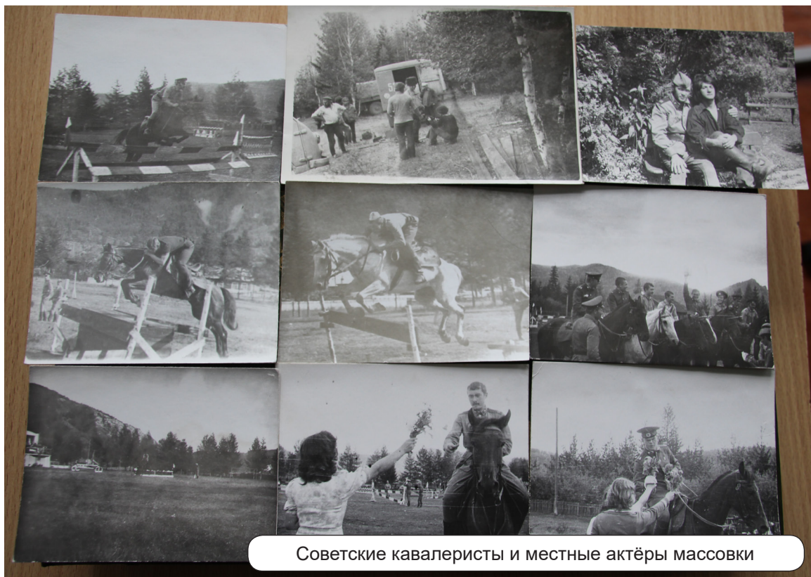
Советские кавалеристы и местные актёры массовки

Дмитрий ТАРТАЧАКОВ.