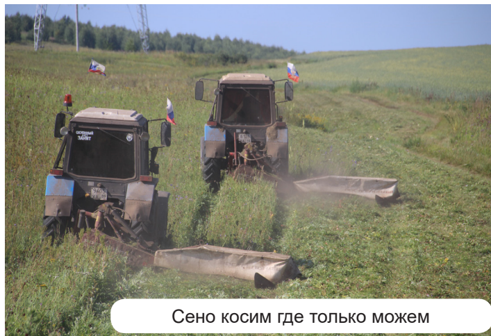
Сено косим где только можем