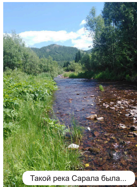
Такой река Сарала была...

И ранее чистая и прозрачная вода горной реки Сарала стала время от времени превращаться в густую, мутную субстанцию цвета глины. И даже когда вода