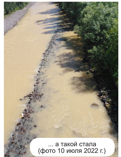
... а такой стала (фото 10 июля 2022 г.)

начинает светлеть, на дне реки камни покрыты слоем липкого коричневого ила. По утверждению местных жителей села Орджоникидзевское, эту картину они наблюдали с мая по июль этого года. Такая ситуация не может не волновать местное население, поэтому они забили тревогу. В происходящем обвиняют золотодобытчиков. Были и идут обращения во многие инстанции.