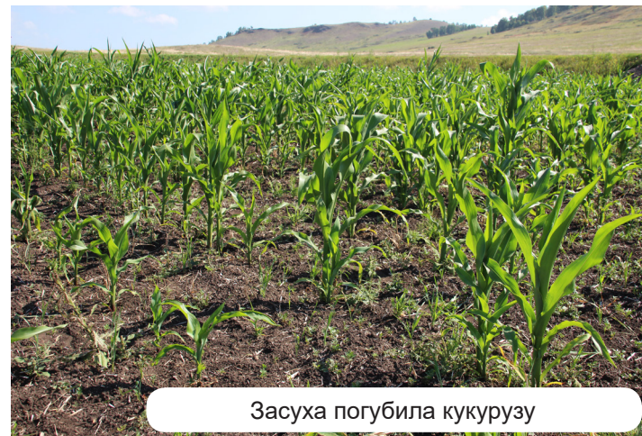
Засуха погубила кукурузу