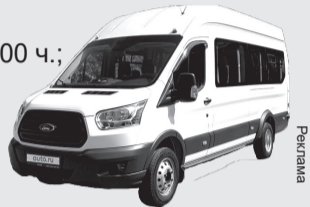
Лицензия № АК-24-001943 от 16.07.2019

Предоставляются документы для отчётности